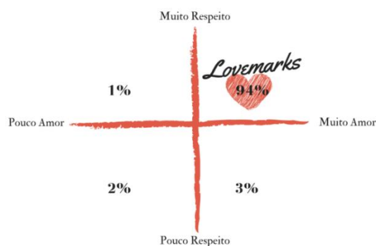
Figura 03: Caracterização de Rebelde de acordo com os quadrantes de Roberts (2004), sobre lovemarks .

resultado de um trabalho estratégico da marca, e sim uma relação de seus fãs com a marca, uma vez que esses possuem autonomia sobre a mesma, e acabam deixando explícito seu sentimento. O respeito, aspecto importante para existência do amor, é reforçado por 71,5% que afirmam possuir muito respeito pela marca. Unidos, o amor e o respeito foram capazes de influenciar o modo como esses fãs agem em seu cotidiano. Cerca de 38% concordam plenamente com as frases “Rebelde me inspirou a tomar decisões importantes” e “Rebelde ajudou a superar situações difíceis”. Dos respondentes, 40% afirmaram que a marca mudou aspectos em sua vida e 42% responderam que Rebelde ajudou a formar valores de vida. Assim, o mistério se faz presente mais uma vez, pois percebe-se como a marca os inspira em suas ações e está presente na formação de seus valores pessoais. Roberts (2004) aborda a inspiração como aspecto fundamental para que as marcas se transformem em lovemarks .