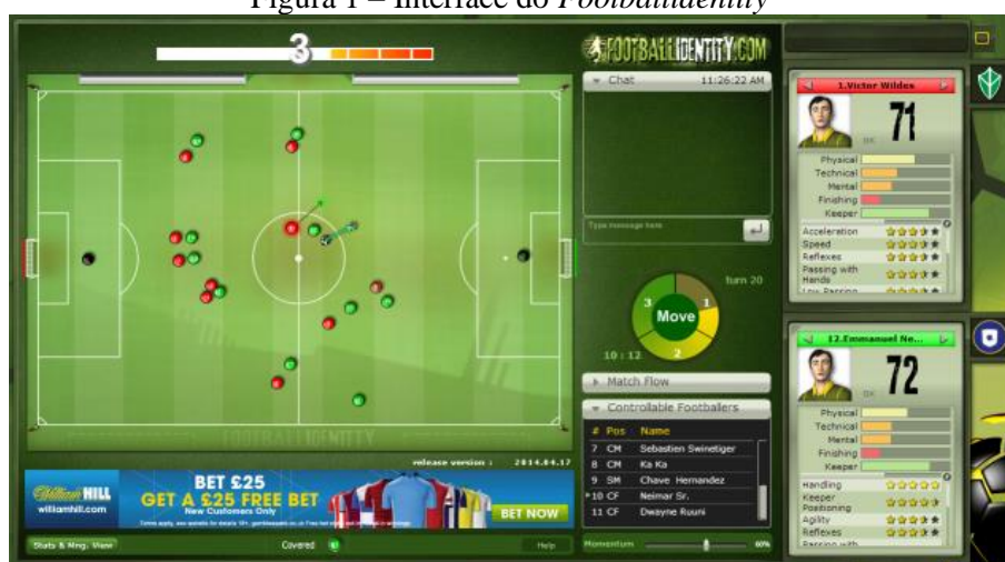
Figura 1 – Interface do Footballidentity

O Footballidentity – apresentado na Figura 1 - é uma aplicação on-line e gratuita de futebol, utilizada exclusivamente no navegador do smartphone , tablet ou notebook 2 , formado por personagens controlados apenas por pessoas reais cadastradas na plataforma https://www.footballidentity.com ou que baixaram o jogo pelo site https://www.baixaki.com.br (FOOTBALLIDENTITY, 2020).