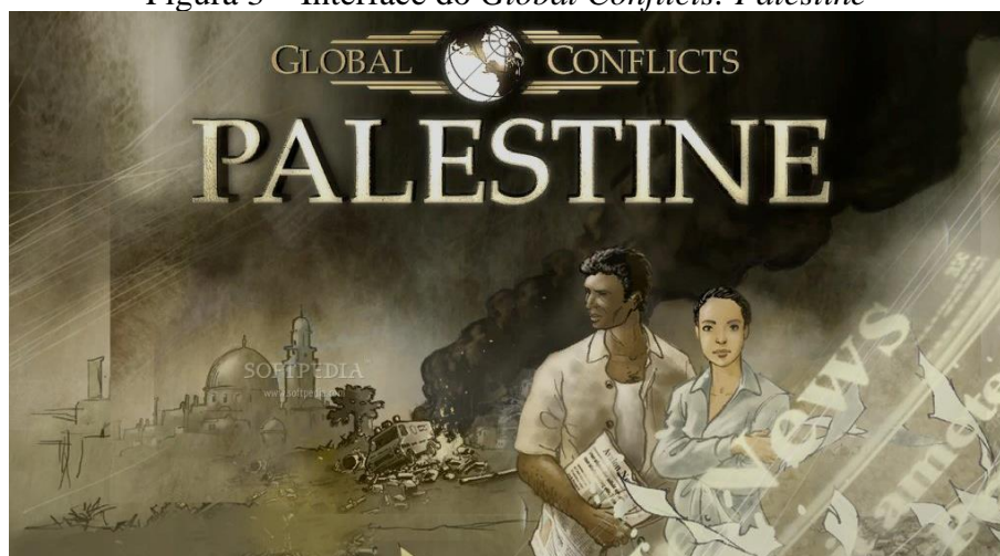
Figura 3 – Interface do Global Conflicts: Palestine

e no site https://www.baixaki.com.br , é uma simulação que apresenta aspectos reais do trabalho de um jornalista freelancer em uma área de extremo conflito, conforme demonstrado na Figura 3.