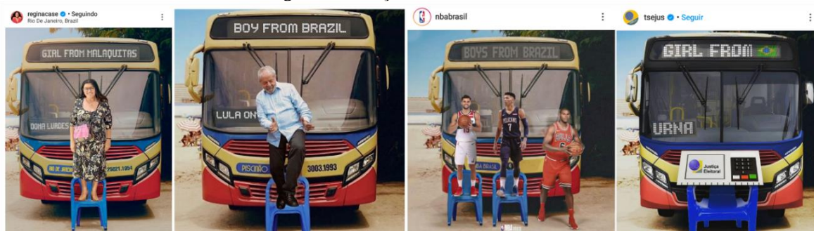
Figura 2: Variações do meme GFR

Ações como esta se unem a outro conjunto de estratégias que possibilitam o aprendizado de técnicas que fortalecem outros letramentos e abrem espaço para que um número maior de pessoas – guardadas as imensas desigualdades sociais que atravessam nosso país – participem ainda que de modo lúdico do evento memético. Em se tratando de personalidades, instituições e pessoas que exercem algum tipo de influência midiática no Brasil temos a apropriação do meme Girl From Rio nesta dimensão da zoeira pela atriz Regina Casé, o ex-presidente Lula, os atletas brasileiros que participam do torneio da NBA e a urna eletrônica apresentada no meme postado no perfil do TSE-JUS como ‘ Girl From Brasil ’ (Figura 2).