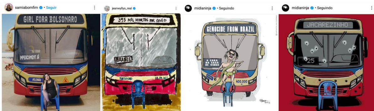
Figura 3: Variações do meme GFR apresentando denúncia, protesto, clamor social e posicionamento político