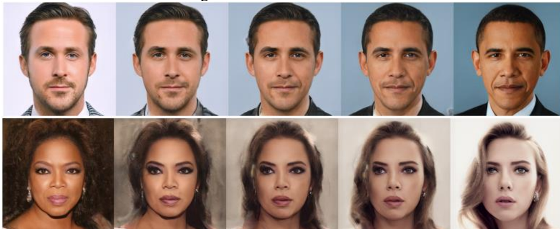
Figura 3: Resultados variados.