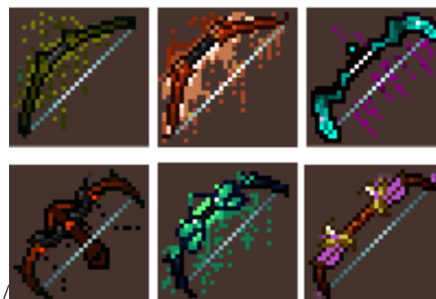
Figura 7: Assets criados pelo modelo generativo.

A outra rede criou, a partir de ruídos, diversos modelos de assets 2D. Esses modelos foram melhorando com o passar das épocas e analisados pelo discriminador (Figura 7).