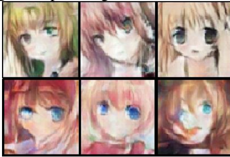
Figura 4: Imagens de personagens variados feitos em 50 épocas.