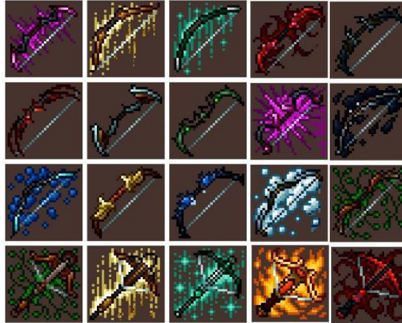
Figura 6: Imagens utilizadas no banco de dados.

Partindo do modelo de algoritmo proposto Goodfellow et al (2014), foi feito um estudo da rede usando os dados assets 2D de arcos-flecha de 32x32 pixels . Algumas dessas imagens podem ser vistas na Figura 6.