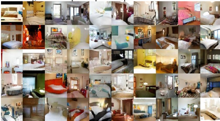
Figura 5: Criação de quartos a partir das Gans.

As imagens geradas pelo modelo podem ser de vários formatos. Elas podem ser de pessoas, animais, objetos e até de parte de cômodos domiciliares. Um exemplo pode ser visto na Figura 5.