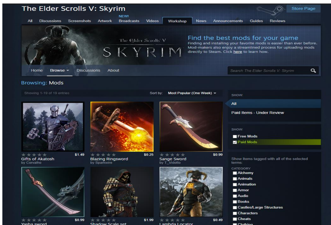
Figura 4: Página da Steam Workshop para mods pagos do jogo The Elder Scrolls V: Skyrim

A ferramenta permite a edição e criação de conteúdo em conjunto com o código-fonte do jogo. Segundo a empresa, “é a mesma ferramenta que usamos para criar o jogo e estamos colocando o poder de criar novos conteúdos em suas mãos”. A Bethesda criou em 2017 a Creation Club, plataforma que divulga e facilita a instalação com um catálogo modificações da comunidade (BETHESDA, 2017). Outras empresas também seguiram essa abordagem, como a Eletronic Arts que implementou um sistema de compartilhamento de criações para o jogo The Sims. Em 2018, Minecraft ganhou uma API de scripts que permite alterar o código-fonte do jogo usando linguagem JavaScript (STONE, 2018). A empresa Valve Corporation, responsável pela plataforma de gestão de jogos e direitos digitais, implementou em seu software Steam um sistema de criação e instalação de mods , nomeada Steam Workshop. Em 2015, a plataforma chegou a contar com um sistema de monetização de modificações (Figura 4) onde os modders poderiam ser remunerados pelo download de suas criações no jogo Skyrim (VALVE, 2015).