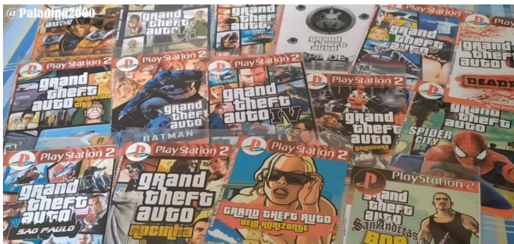
Figura 6: Diferentes modificações não-oficiais do jogo Grand Theft Auto: San Andreas