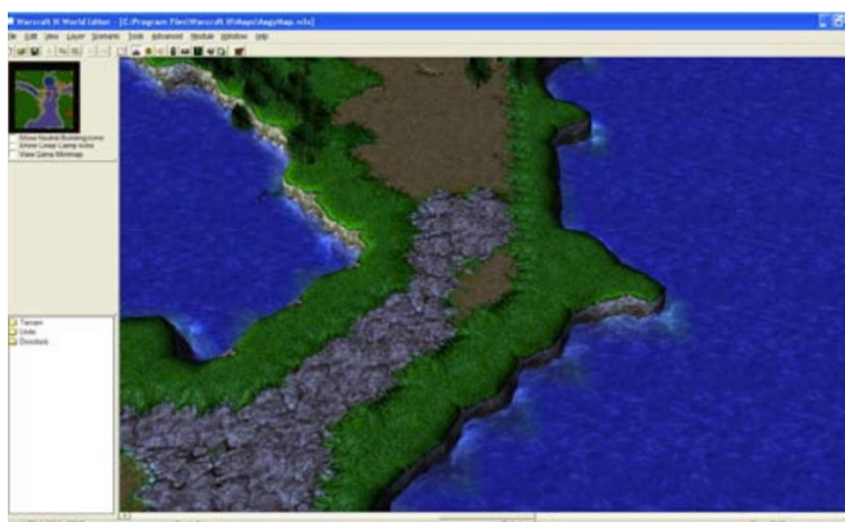
Figura 2: World Editor do Warcraft III

A Blizzard, quando lançou em 1994 o jogo Warcraft: Orcs & Humans, criou uma funcionalidade de edição de modelo de bonecos. Quando lançou em 1995 o Warcraft II, StarCraft (em 1998) e Warcraft III (em 2002), a Blizzard disponibilizou pacotes de criação de conteúdo para os seus consumidores que permitiam editar modelos, personalizar texturas e, posteriormente, criar novos personagens e novas quests (missões). Esse SDK foi chamado World Editor (Figura 2).