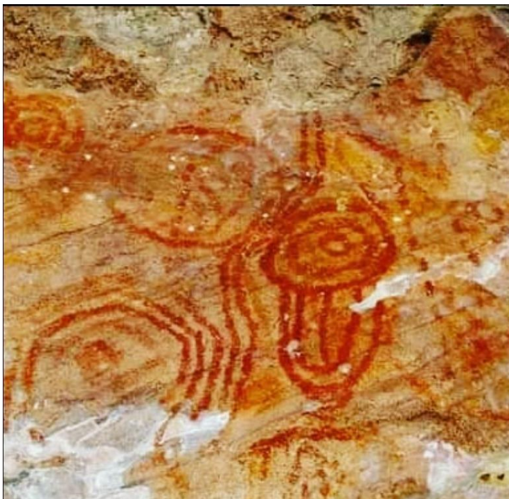
Figura 3- Pintura rupestre em espiral, registrada na Pedra da Letra.