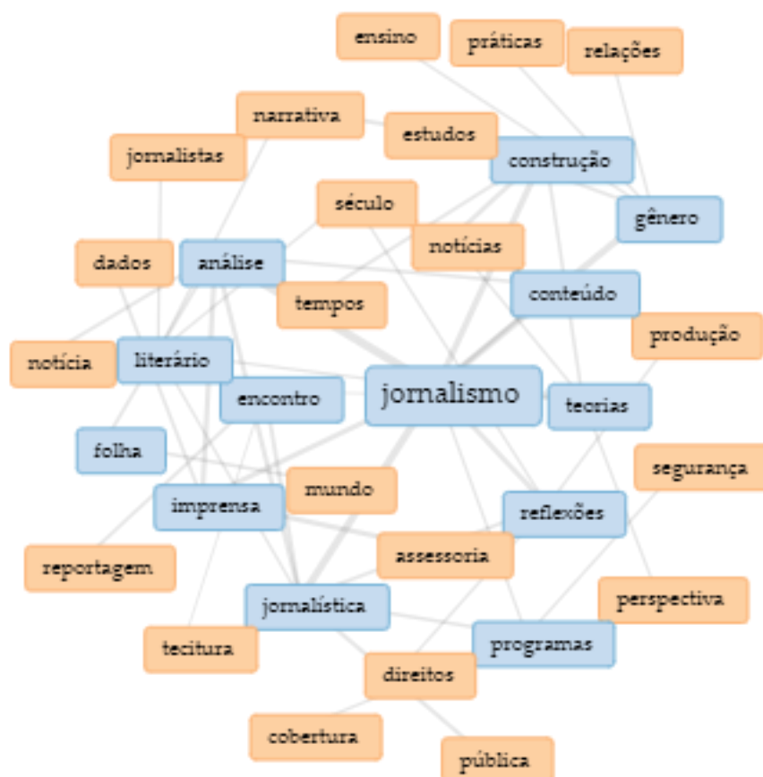
Figura 1 – Termos de correlação nos títulos

“Jornalismo” é o termo que aparece com maior recorrência entre os títulos dos 424 trabalhos e, portanto, ganha mais destaque. A partir dele, são estabelecidas as correlações com diferentes graus de intensidade, sendo que a cor azul representa a maior incidência e a rosa, a menor incidência. Além disso, a disposição espacial indica a aproximação entre os termos, ou seja, aponta quanto maior o número de citações, mais próximos os termos estão.