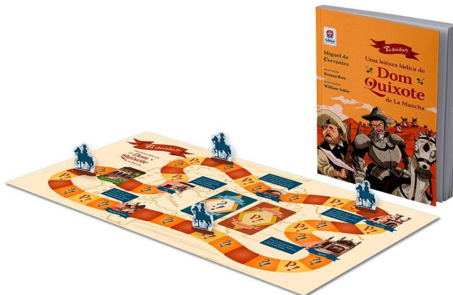
Figura 2 – O jogo de tabuleiro