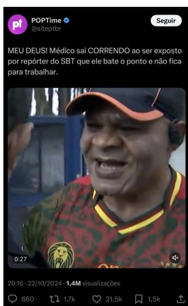
Imagens 7 e 8: Reprodução dos cortes da série no X e comentários dos usuários

Cortes da série, por exemplo, foram reproduzidos por diferentes contas na plataforma X (antigo Twitter), inclusive por perfis grandes, como a POptime , que tem quase 900 mil seguidores. Essa disseminação ajudou a romper a barreira do público restrito à TV, ampliando o alcance da série. As publicações com os cortes ainda geraram interações de outros usuários, que não só satirizam a postura dos médicos retratados, mas também comentam o conteúdo jornalísticos em si.