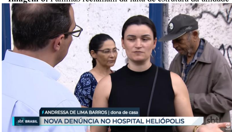
Imagem 6: Famílias reclamam da falta de estrutura da unidade

Ademais, após fiscalização das escalas dos médicos, motivadas pela série de reportagens, foram reveladas diversas fraudes e, com isso, a equipe de reportagem continuou destacando os impactos destes casos na vida dos moradores da comunidade, que ficam sem atendimento e não tem garantidos os seus direitos à saúde, como está explícito na Constituição Federal de 1988, em seu artigo 196.