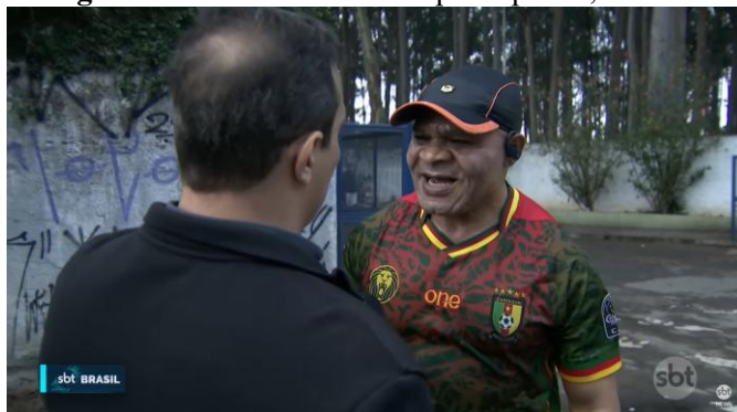
Imagem 1: Médico é abordado por repórter, mas corre

Um dos casos mais marcantes, que inclusive virou meme na internet na época 3 , é o de um médico que, mais de uma vez, foi pego chegando ao hospital vestindo roupa de treino e saindo da unidade logo após registrar o ponto, correndo. Em uma das vezes, o repórter chega a questioná-lo o motivo dele estar indo embora, sendo que havia acabado de bater o ponto, mas o profissional ignora a pergunta e sai novamente correndo.