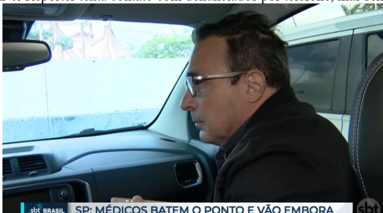
Imagem 4: Repórter tenta contato com denunciados por telefone, mas sem sucesso

Continuando com a premissa da ética jornalística de escutar todas as partes, as três reportagens mostram cortes do Fábio Diamante tentando entrar em contato com os médicos acusados, mas eles não atendem. E em casos nos quais não apareciam esses cortes, isso era reforçado pelo apresentador do SBT Brasil, César Filho, em nota pé, o que revela justamente a intenção de demonstrar que todas as partes envolvidas foram ouvidas, ou pelo menos procuradas, para evidenciar o princípio básico do jornalismo de dar voz à todos.