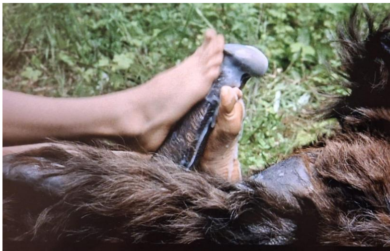
Figura 3 - Romilda e o monstro