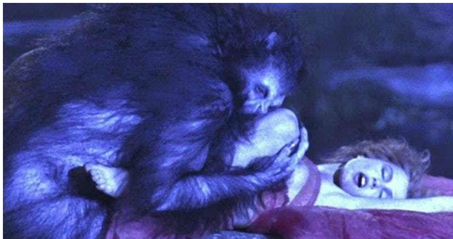
Figura 1 - Lucy e Drácula