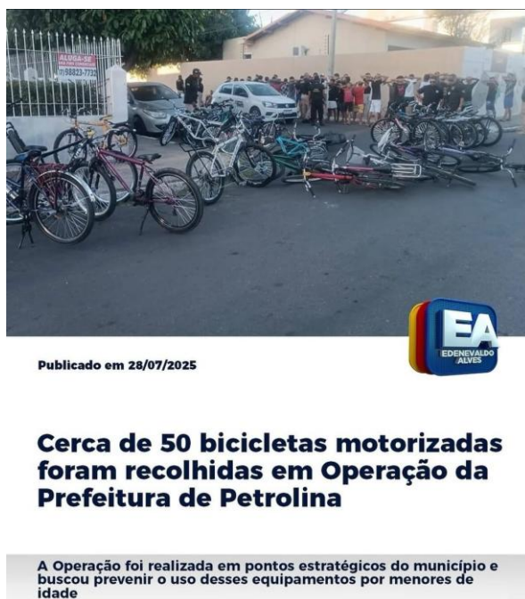
Figura 5: Publicação do Blog Edenevaldo Alves no Instagram em 28 de julho de 2025