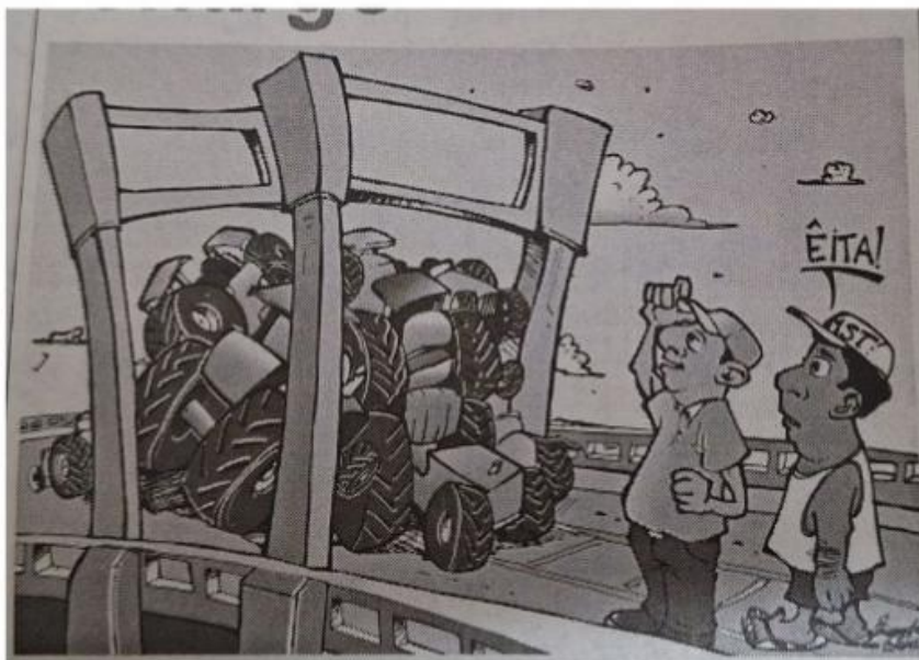
Figura 2: Charge de Alexandre Esteves publicada em 24 de maio de 2006, edição Nº 830