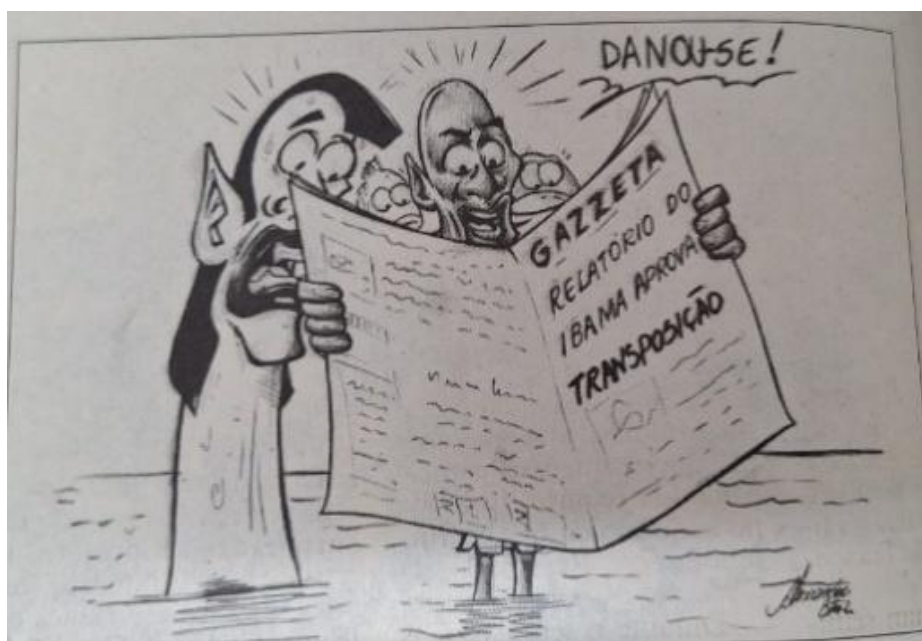
Figura 3: Charge de Alexandre Estevez publicada em 27 de abril de 2005, edição Nº 573