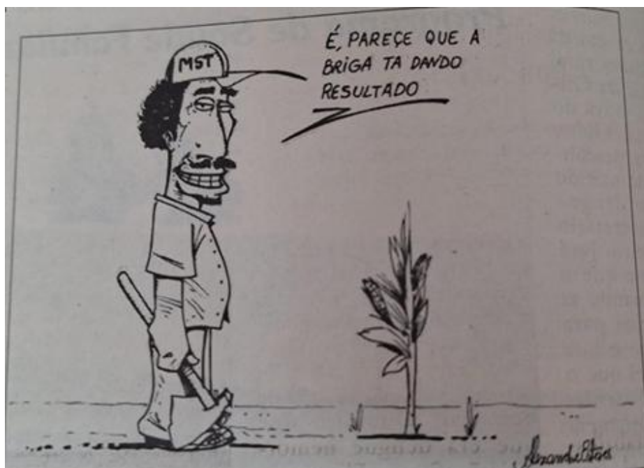
Figura 1: Charge de Alexandre Esteves publicada em 22 de abril de 2005, edição Nº 570.