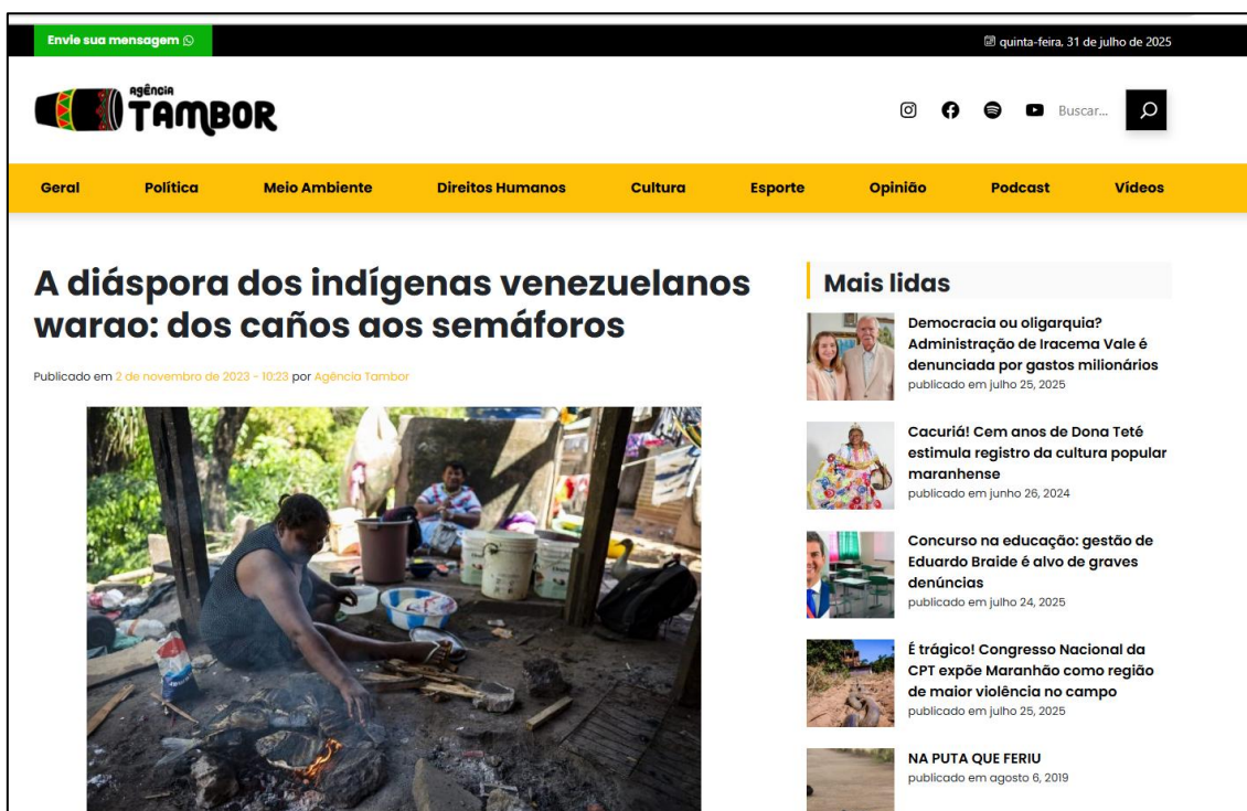
Figura 5 – Layout da Reportagem 6 14