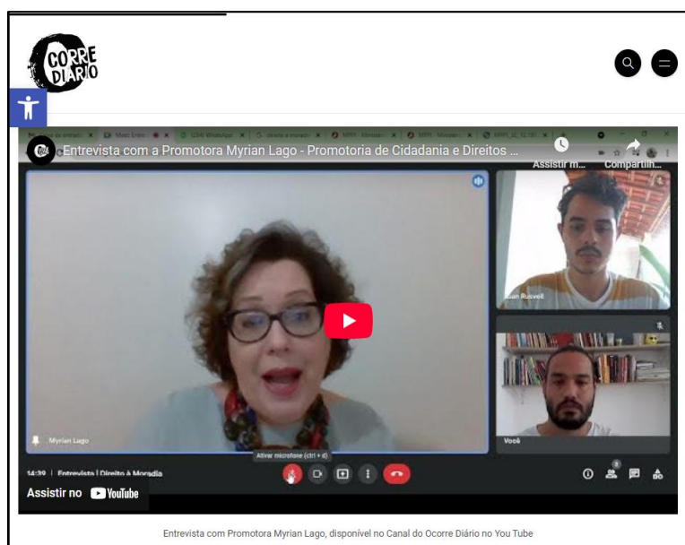
Figura 4 – Vídeo integrante da narrativa da Reportagem 10 13

Na análise, percebeu-se que, apesar dos recursos visuais favorecerem a conexão entre o conteúdo da reportagem e o público, é notável a qualidade das fotografias que foram registradas por fotógrafos profissionais ou fotojornalistas. Algumas imagens estão em baixa resolução ou ampliadas, de forma a ficarem desfocadas e com pixels visíveis.