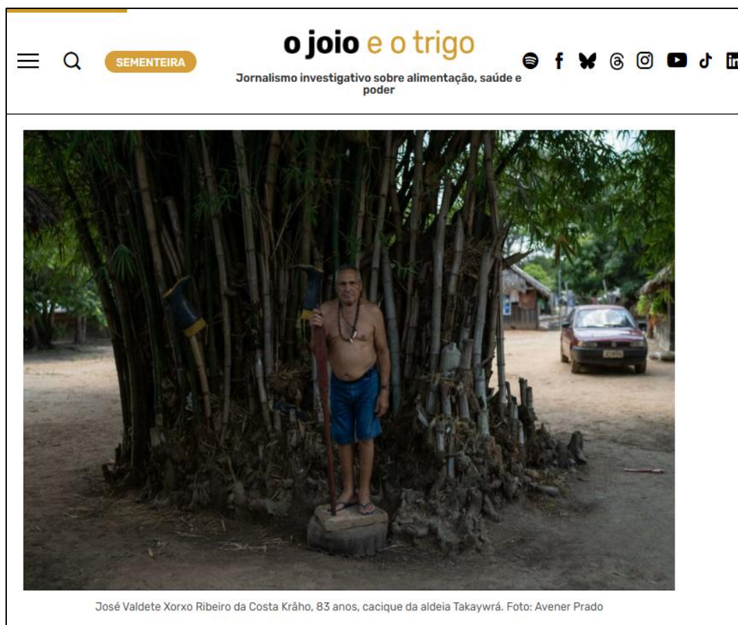
Figura 2 – Uso da fotografia na Reportagem 5 11