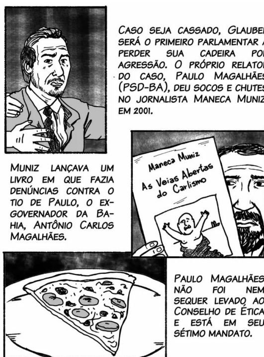
Figura 6 - Ilustrações dos personagens mencionados