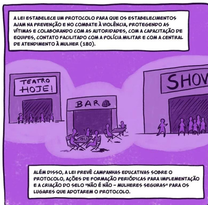
Figura 4 - Uso da linguagem simples e visualização do local dos fatos