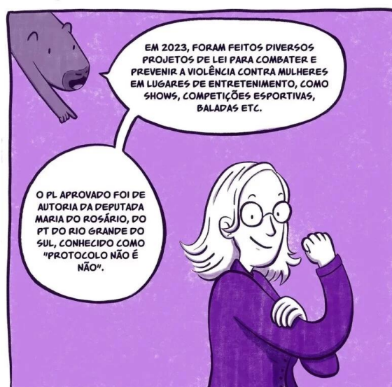
Figura 3 - Uso da linguagem simples e alegoria