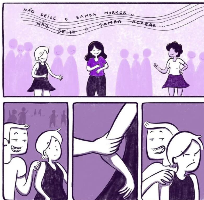
Figura 2 - Uso do passo a passo das ações e visualização do local do fato