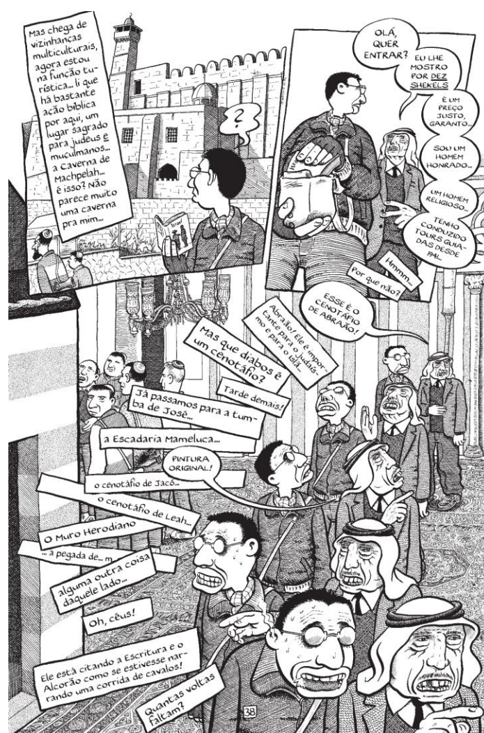
Figura 1 - Página da JHQ “Palestina”

para encaixar a HQ Palestina 4 do jornalista maltês Joe Sacco, que durante sua viagem à Palestina para a produção de uma HQ autobiográfica, percebeu que sua postura não era de apenas quadrinista, sentia que estava sendo jornalista em primeiro plano. “Sacco apurou, entrevistou e, ao fim, não foram suas próprias histórias que ele transformou em relato, mas as histórias das pessoas que encontrou por lá” (Paim, 2023, p. 20).