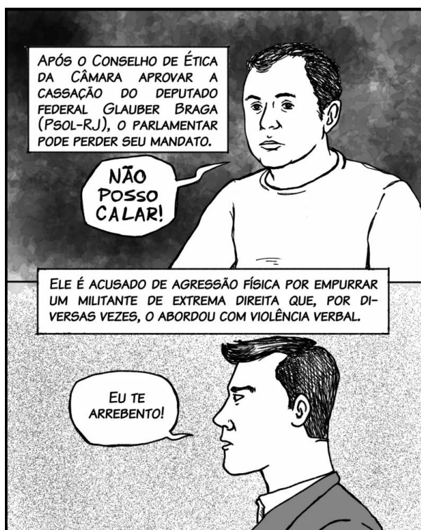
Figura 5 - Ilustrações dos personagens mencionados