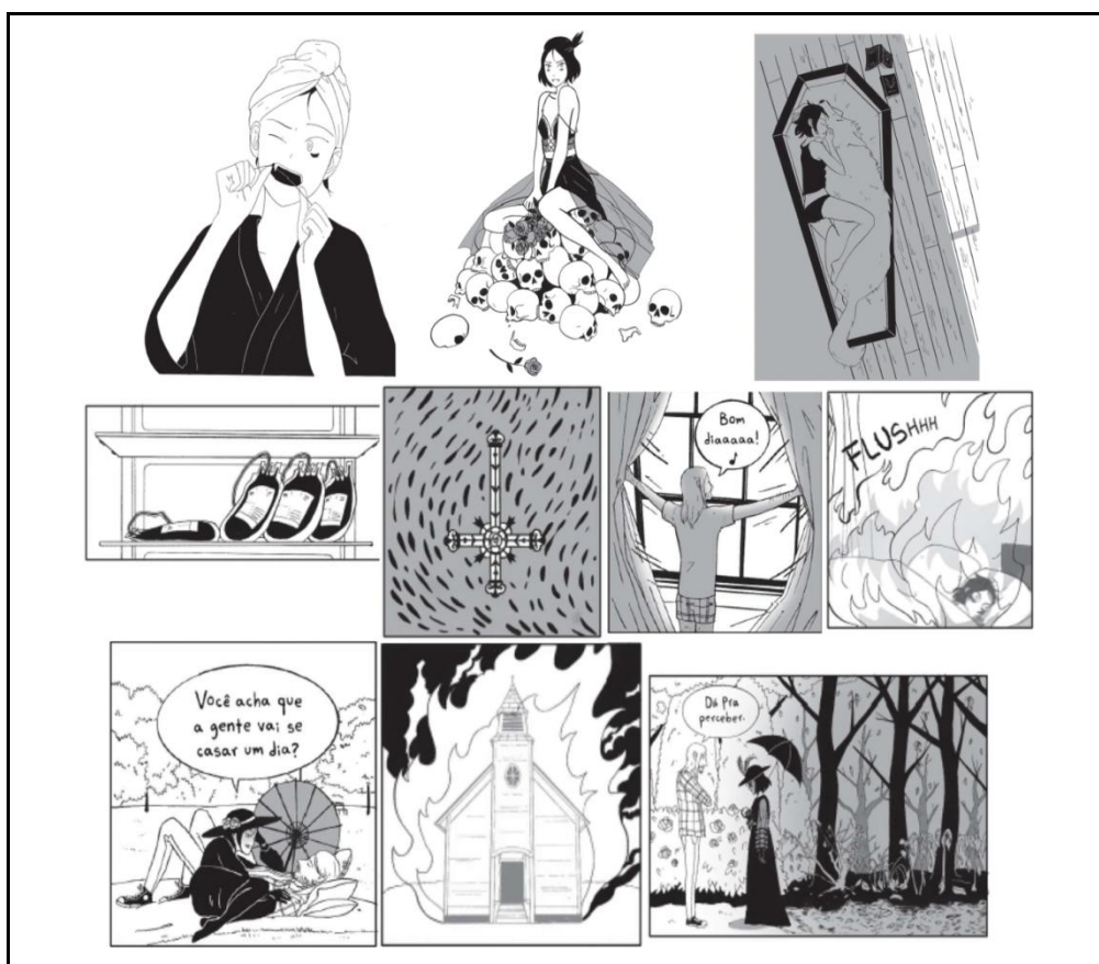
Figura 4: Recortes dos signos.

este ser não-humano, por vezes monstruoso, mas que em Mordida (2021) é estilizado. Segundo Sant'anna (2003), Estilização é um artifício de retomada, neste caso, de um personagem, sem explodir os limites que o delimitam, assim, de um determinado código. Em nossa análise, nos interessa uma das manifestações deste recurso narrativo: a Recriação. Tal mecanismo se revela na representação do vampiro, na apropriação de características já consagradas e na implementação de novas marcas. Isto porque temos a retomada do gótico a partir da vampira, porém, há uma atualização no enredo: o cotidiano partilhado entre dois seres com presas, uma vampira e um lobisomem, os quais se envolvem em um relacionamento amoroso.