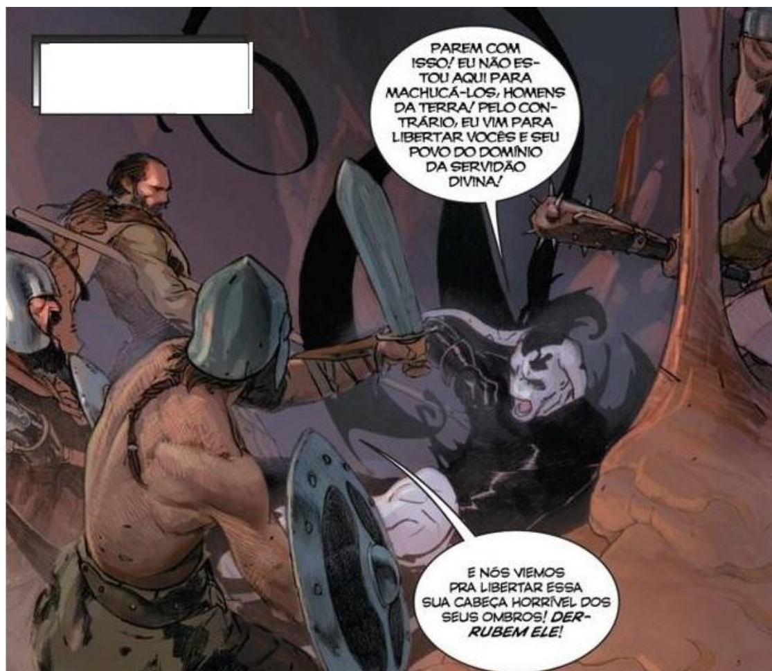
Figura 3 – Gorr discute com humanos