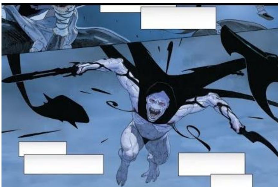
Figura 2 – Gorr avançando contra Thor

Neste sentido, a representação imagética do mal trata-se, muitas vezes, da representação do feio, do imperfeito, ou seja, o contrário do belo (Faria, 2012). A maldade, neste caso, estaria associado à visualização de tudo aquilo que transgride o ideal de beleza e bondade. Por esta ótica, os elementos grotescos e estranhos à beleza humana surgem para se relacionar e figurar a personalidade monstruosa e psicopata do Gorr que, internamente, se assemelha a uma besta feroz, sedenta por sangue.