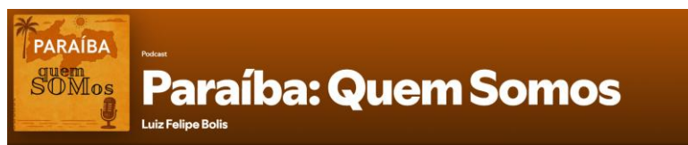
Figura 1 – Interface do Podcast “Paraíba: Quem Somos”

A quarta etapa ( Edição ). Com os cinco scripts em mãos e as gravações dos áudios-narração, as edições de áudio foram realizadas no programa Audacity, resultando nos cinco episódios de podcast, com os seguintes títulos e tempos individuais: 1) Eloá: a menina que foi para Harvard (22m32s); 2) Coronel Arthur: na linha de frente do resgate (23m46s); 3) Adriana: Paraíba e Suíça em ritmo de São João (26m39s); 4) Kaline: das campinas da Paraíba às passarelas do mundo (27m30s); 5) Ronny: a paixão pelo futebol e o sonho de imigrar entram em campo (21m32s). Eles podem ser acessados na plataforma Spotify ( https://open.spotify.com/show/3x2FZIGwZwLC9YxMDA70rP ), o que se configura como a Apresentação dos conteúdos .