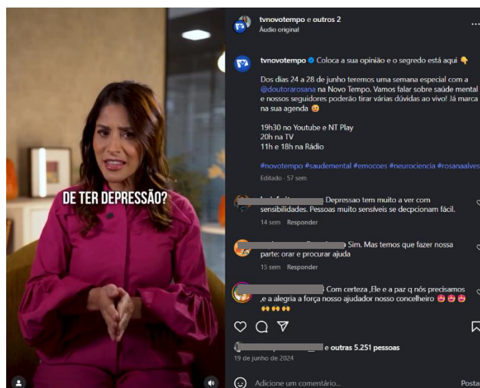
Figura 5 - Reel Saúde mental