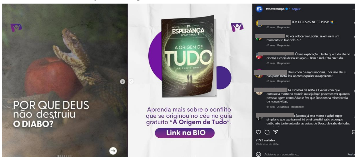
Figura 2- Por que Deus não destruiu o diabo?