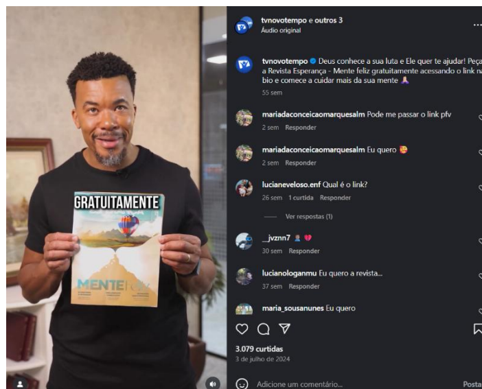
Figura 6 – Reel Revista Mente Feliz