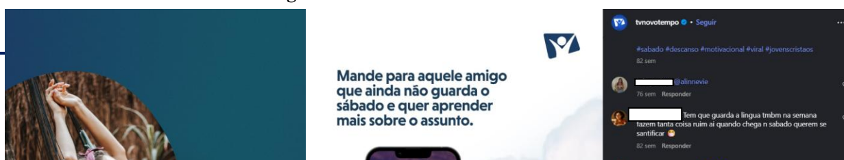
Figura 1 - como descansar no sábado?

Em relação ao conteúdo, a primeira publicação analisada foi o post destacado na Figura 1 - “Como descansar no sábado?”, que apresenta a imagem de uma mulher deitada na rede, acompanhada da pergunta que dá título à figura. O design da peça gráfica segue um padrão visual atrativo com a cor azul que harmoniza com a identidade visual da Novo Tempo. Na descrição, são incluídas algumas hashtags , sendo este um dos critérios para a análise dessa pesquisa.