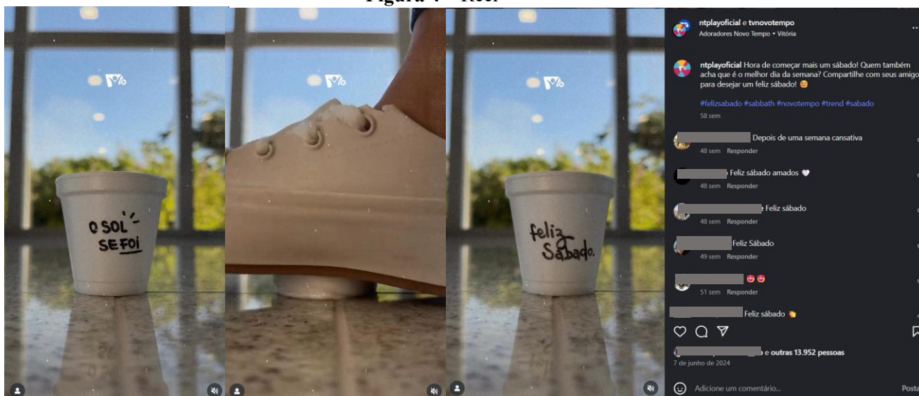
Figura 4 – Reel