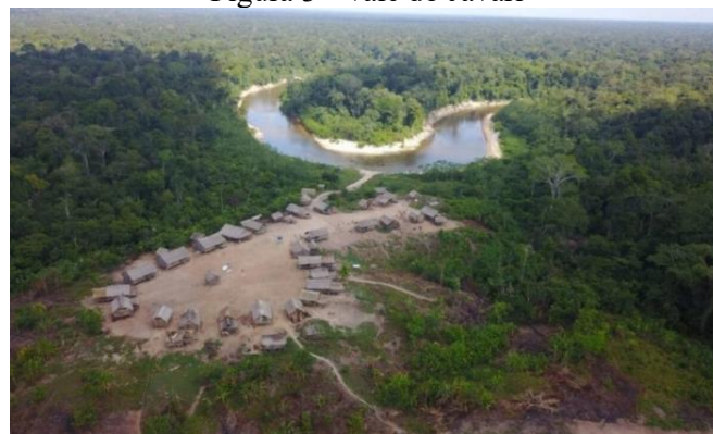
Figura 3 - Vale do Javari