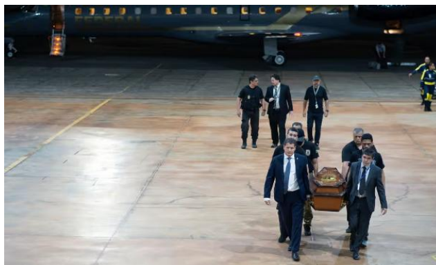
Figura 5 - Restos mortais de Dom Phillips sendo transportados