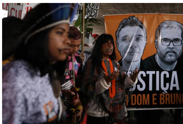
Figura 8 - Protesto na Paulista pedindo justiça por Bruno e Dom

Como recursos visuais, ambos veículos utilizam fotos do momento que Jefferson foi preso, o NY Times utiliza na manchete a imagem do protesto dos indígenas na avenida Paulista pedindo justiça por Bruno e Dom (Figura 8) e no corpo do texto utilizam uma foto de Jefferson na qual ele está com a cabeça baixa usando boné e capuz tapando o rosto. Já o The Guardian, utiliza duas fotos onde o ponto central é a prisão de Jefferson, o jornal britânico traz na manchete uma foto do momento de sua prisão e depois, outra foto com Jefferson, mas este de costas para a câmera e com três policiais armados com os rostos censurados.