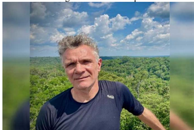
Figura 2 - Dom Phillips

— Jornalista Dom Phillips apurava reportagem no Vale do Javari