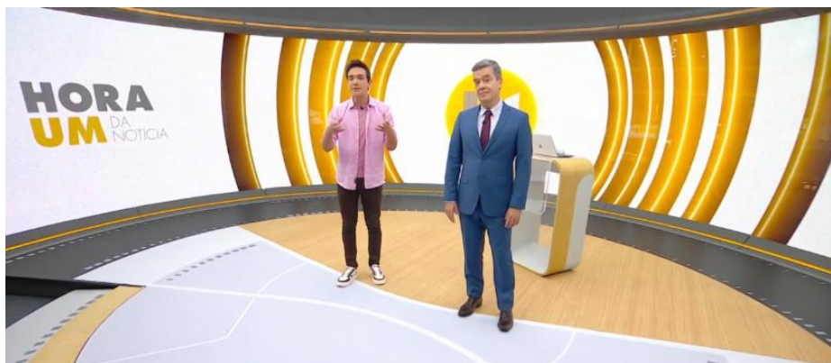
Figura 4 – Terceira fase do telejornal Hora Um