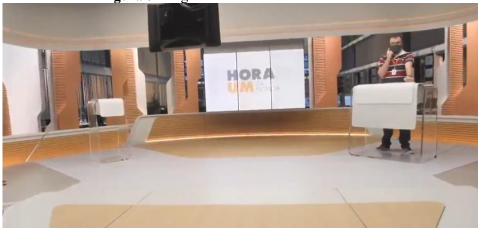
Figura 3 - Segunda fase do cenário do Hora Um

A mudança para um estúdio compartilhado, mais moderno e amplo, marca um ponto de inflexão. A substituição da bancada fixa por um púlpito móvel não foi apenas uma alteração estética, mas uma mudança na linguagem corporal e na dinâmica de apresentação. Essa maior mobilidade do âncora confere mais fluidez e um tom mais conversacional, humanizando a figura do jornalista e aproximando-o do público. E isso ocorre, segundo Silva e Penteado (2014, p. 62), a partir da expressividade: “[...] englobando mais recursos verbais, vocais e não verbais, que precisam se apresentar de maneira harmônica, coerente e complementar, além de serem empregados, também, como recursos de ênfases”.