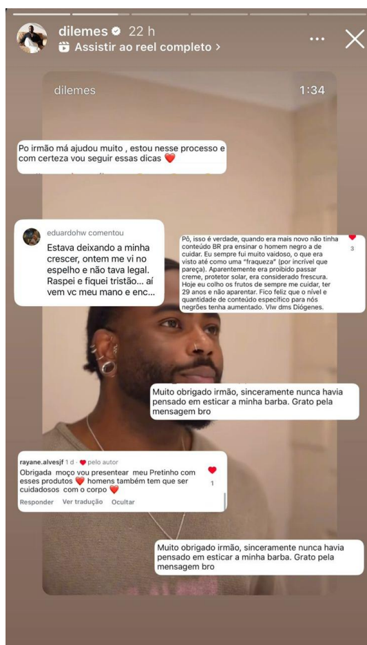
Figura 4 – Foto reprodução de story do Instagram, onde o influenciador compartilha feedbacks positivos de um dos vídeos produzidos para a rede social.

A produção de conteúdo digital permite não apenas a valorização da estética e da ancestralidade negra, mas também a sensação de pertencimento construída a partir das comunidades virtuais nas quais o homem negro pode se reconhecer e se fortalecer – contribuindo para a elevação da autoestima ao oferecer representações que quebram os padrões de masculinidade impostos pela branquitude hegemônica.