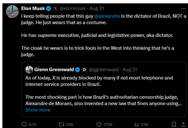
Figura 5 – Uso do termo ditador no X.