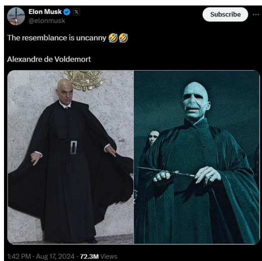
Figura 3 – Alexandre de Voldemort no X.

Fonte: captura realizada pelos autores, 2025.