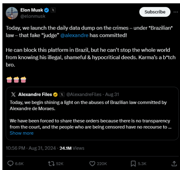
Figura 6 – “Fake judge” no X.