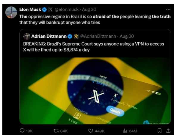
Figura 7 – A defesa da “verdade” no X.