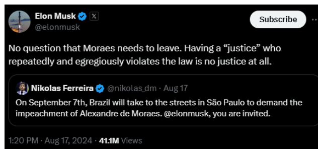
Figura 4 – Elon Musk e Nicolas Ferreira no X.