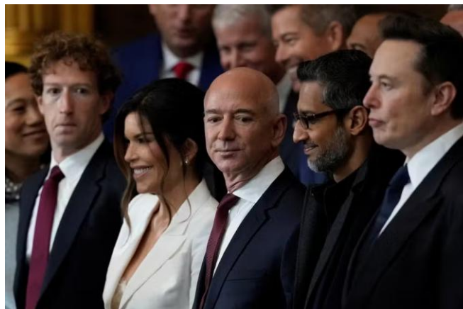
Figura 1 – Donos de Big Techs na posse de Trump.