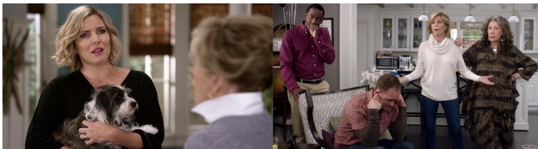
Figura 1 – Cenas 1 e 2

Para ilustrar e exemplificar a análise da série como um todo, foram selecionadas oito cenas. 4 A Cena 1 (figura 1) pertence ao nono episódio da primeira temporada. Grace tenta convencer sua filha Brianna, agora sua sucessora como presidente da Say Grace , sua empresa de cosméticos, de que o lubrificante vaginal de Frankie é uma ótima alternativa natural, livre de substâncias sintéticas, mas a filha faz de tudo para não a escutar, repreendendo a mãe por estar falando sobre o assunto e chamando as protagonistas de “senhoras sujas”. No fim, a Brianna leva o produto para casa e acaba percebendo sua qualidade e utilidade, procurando Frankie mais tarde para fechar negócio. No decorrer da trama, Frankie acaba sendo deixada de lado na negociação, pois a filha de Grace quer que tudo sobre o produto, incluindo sua campanha e sua divulgação, seja decidido sob sua própria visão.