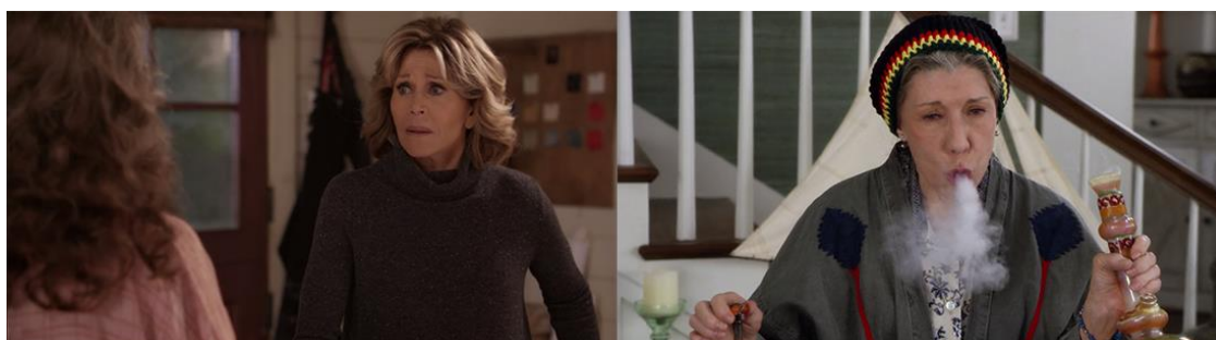
Figura 3 – Cenas 5 e 6

A cena 6 (figura 3) é do quinto episódio da segunda temporada e narra Frankie tendo problemas em passar no teste de renovação da carteira de motorista. Para conseguir o feito, Frankie decide recriar a cena de quando estava estudando para a prova pela primeira vez, fumando maconha – e para isso a caracterização se apropria de elementos das culturas do reggae e da Jamaica, em uma representação caricata e questionável em aspectos raciais. No fim do episódio, ela consegue passar no teste, apesar de só poder dirigir durante o dia. Uma cena singela, mas simbólica quanto à quebra de uma expectativa do imaginário coletivo sobre a velhice e o consumo de drogas ilícitas.