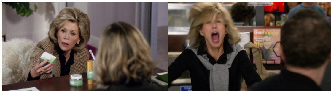
Figura 4 – Cenas 7 e 8

o que é se sentir invisível. Já na cena 8, Grace tenta (sem sucesso) chamar o atendente de um supermercado, que a ignora completamente para atender (e flertar) com uma mulher bem jovem. Grace surta e grita com o homem, afirmando que é errado tratar ela e Frankie (que estava com ela) dessa forma, só por terem “cabelo grisalho”, uma espécie de metonímia para falar do etarismo.