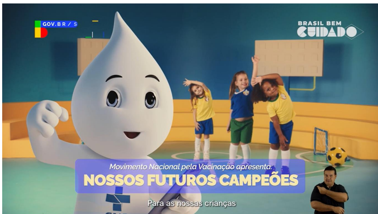
Figura 03 – Cuide bem dos nossos futuros campeões

Pode parecer cedo, mas a preparação dessa turminha já começou. Para as nossas crianças crescerem fortes e saudáveis, mantenha a carteira de vacinação sempre atualizada. Agora o movimento nacional pela vacinação é para proteger contra a Pólio, também chamada de Paralisia infantil, uma doença que pode causar paralisia permanente. Toda criança menor de 5 anos deve ser vacinada. Procure uma unidade básica de saúde e cuide bem dos nossos futuros campeões. Ministério da Saúde. Governo Federal (Ministério da Saúde, 2024 [transcrição do vídeo]).