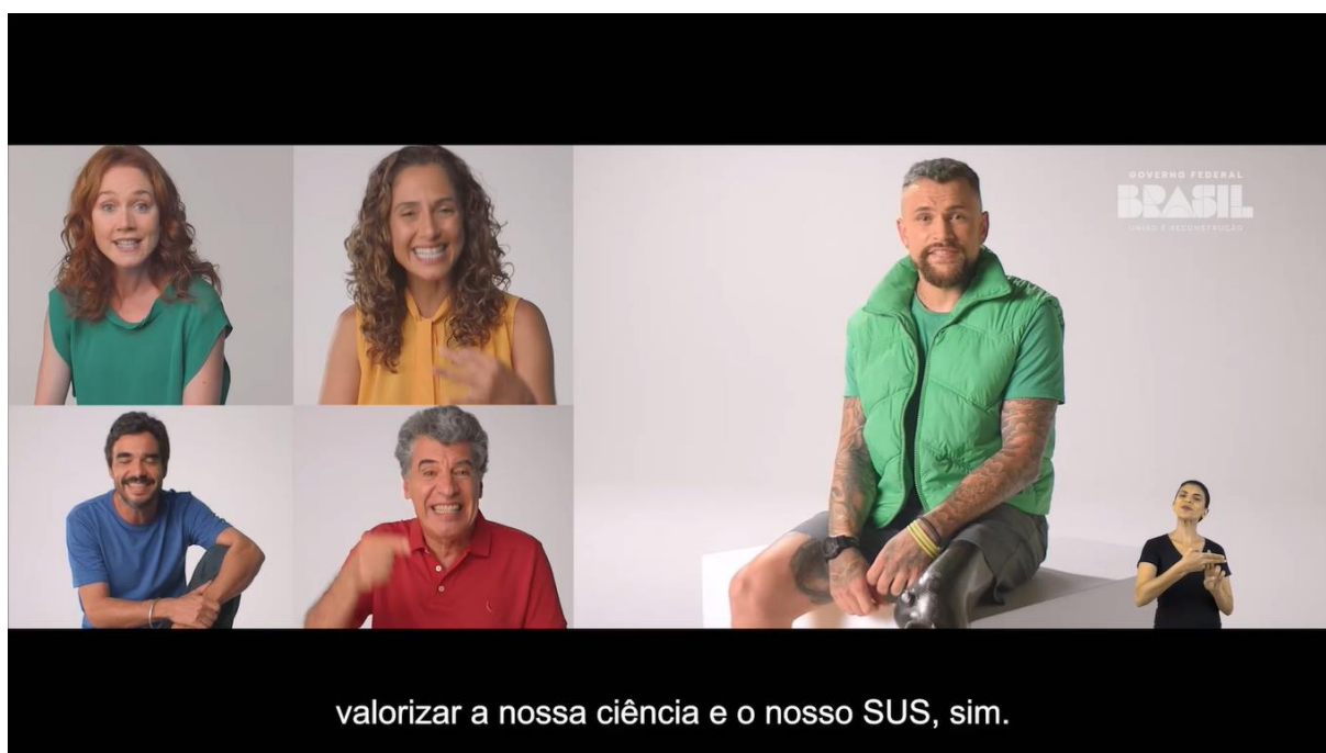
Figura 02 – Movimento nacional pela vacinação

Eu acho que as pessoas não sabem o que dizem quando são contra a vacina. Não sabem o tamanho da dor das famílias que perderam quem amam para uma doença. Não sabem o tamanho da dor dos pais aflitos por seus filhos hospitalizados. Será que é preciso assistir a volta dessa e de outras doenças para acreditarem nas vacinas? Não. Nós não queremos isso. Confiar na vacina tem que ser pelo caminho da vida. Vacinas salvam vidas. Vacinas salvam vidas. Eu quero viver, por isso a vacina. Eu quero ver o Brasil reconstruir a nossa vacinação. Porque o Brasil sempre foi referência em vacinação no mundo. Vamos nos unir ao movimento nacional pela vacinação. Vamos vacinar, sim; valorizar a nossa ciência e o nosso Sus, sim; vamos bater com orgulho no peito e no braço e dizer que vacinas salvam vidas. Vacina é vida. Vacina é pra todos. Ministério da Saúde. União e Reconstrução (Ministério da Saúde, 2023 [transcrição do vídeo]).