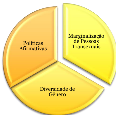
Figura 2: Marginalização, PA e Diversidade de Gênero

Abaixo, apresentamos a Figura 2, que representa justamente o que estamos afirmando.