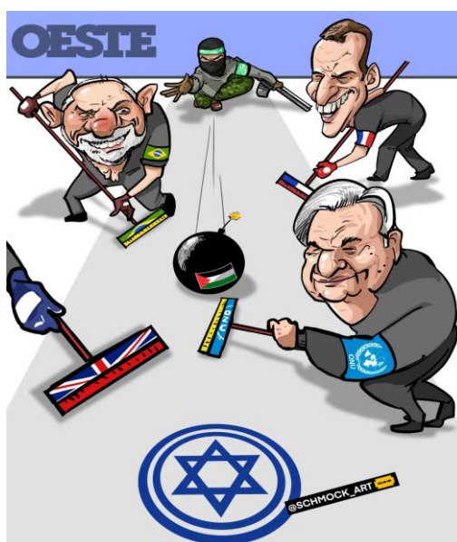
Figura 4 - Charge da Revista Oeste fazendo alusão aos líderes mundiais jogando Curling

Charge referente a Figura 3, intitulada “Entidades do Agro e da indústria se revoltam com ‘ato violento’ de invasores” 12 . A matéria discute os atos violentos dos invasores de terras que feriram 3 policiais com arma, gerando uma reunião dos produtores do Agronegócio para mostrarem repúdio aos atos de violência”. Com isso, percebemos que a compreensão simbólica da ilustração da figura 3 entra em um contexto muito mais avançado: O contexto de publicação da Charge insinua uma certa contrariedade na acusação de fascismo por parte do agronegócio, o qual repudia casos de violência como o referido na matéria, e que por fim produz aquilo que vem à mesa do então presidente.