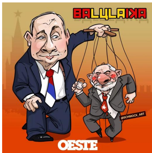
Figura 2 – Charge do presidente Vladimir Putin usando Lula como boneco de ventríloquo

só pode ser identificada com facilidade a partir do momento em que a Charge é colocada em ligação com as notícias do mesmo período no recorte.