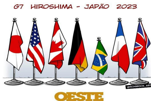
Figura 1 – Charge publicada na Revista Oeste no dia 25 de maio sobre o G7 de 2023.