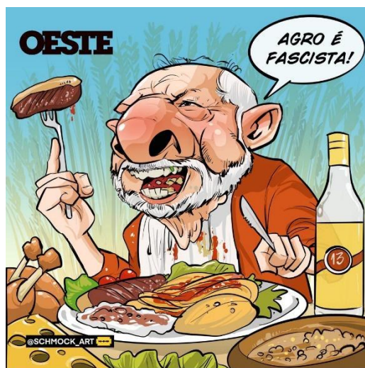
Figura 3- Charge com o então presidente Lula fazendo uma refeição.

Charge, é que entendemos o terceiro e último fato do signo. Numa notícia publicada em 21 de maio (5 dias antes da elaboração da Charge na figura 2), intitulada “ New York Times chama Lula de aliado da Rússia”, discutia-se justamente a posição de Lula de “aliado da Rússia”, ao fugir das aproximações com Zelensky, presidente da Ucrânia.