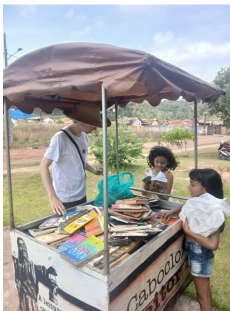
Imagem 4 - Caboclo Leitor em ação no Residencial Salvação