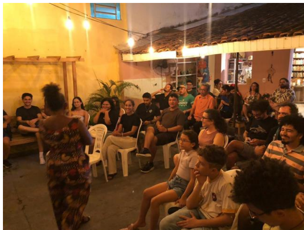
Imagem 6 - Evento no Porão Centro Cultural