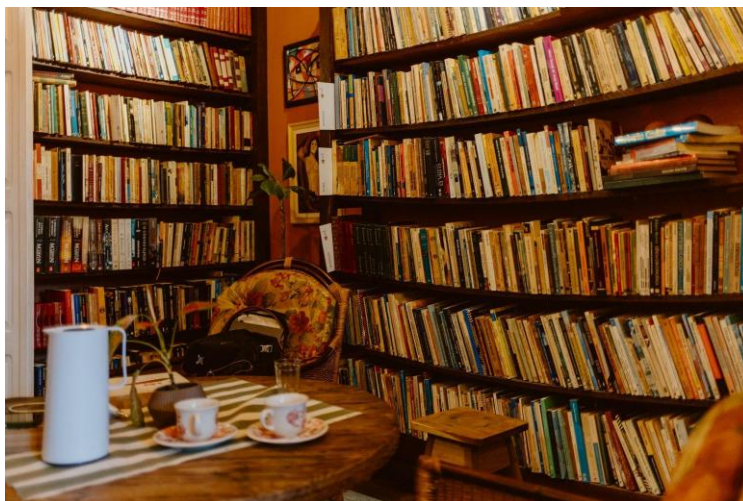
Imagem 3 - Biblioteca Comunitária do Porão Centro Cultural

projeto mantém ainda o Sebo Porão Cultural, em parceria com o Tuy Cultural 4 , configurando uma atuação em rede que conecta diferentes territórios urbanos amazônicos.