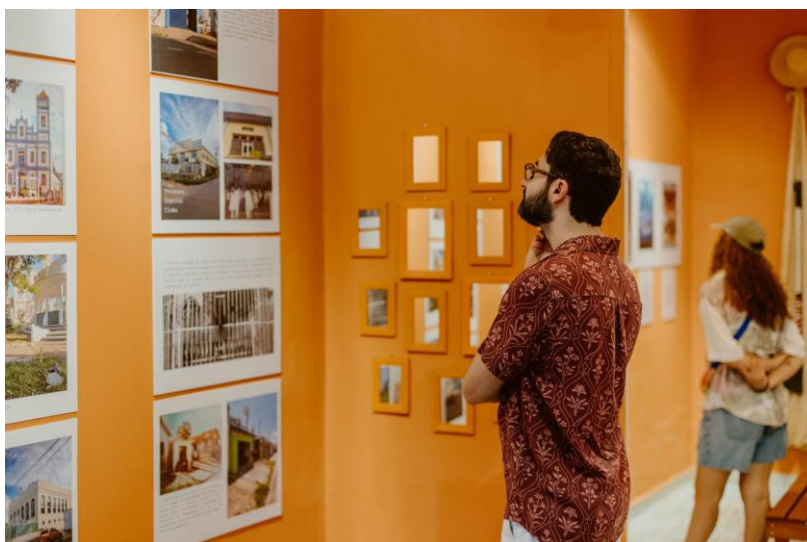
Imagem 5 - Exposição Memórias da Alegria

frequentemente centrada em narrativas oficiais, para uma perspectiva situada e comunitária, na qual a memória urbana se constrói a partir da experiência vivida e da oralidade (Paes Loureiro, 1995) ao tratar das matrizes simbólicas amazônicas. A recorrência de interações afetivas dos moradores com a exposição, ao buscarem reconhecer suas próprias histórias no acervo, revela como o espaço atua como dispositivo de pertencimento e reinscrição simbólica do território.