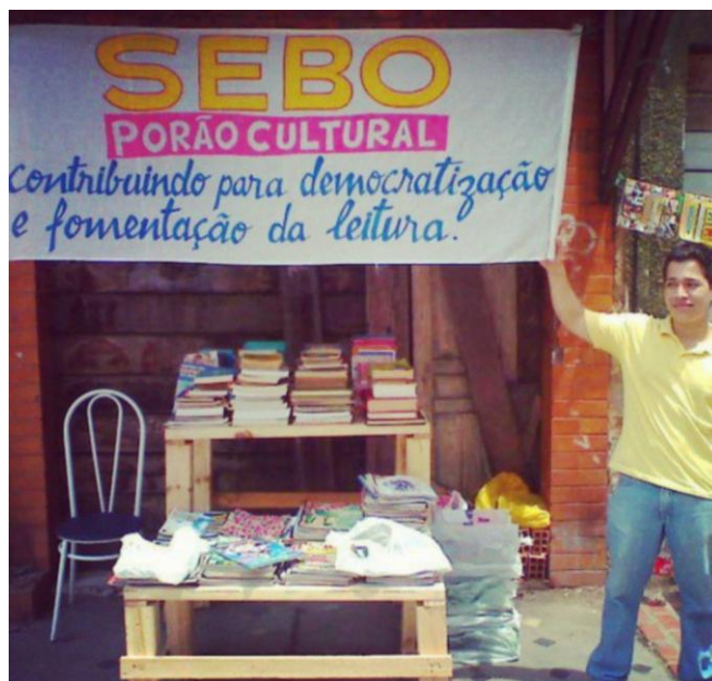
Imagem 1 - Sebo Porão Cultural antigamente