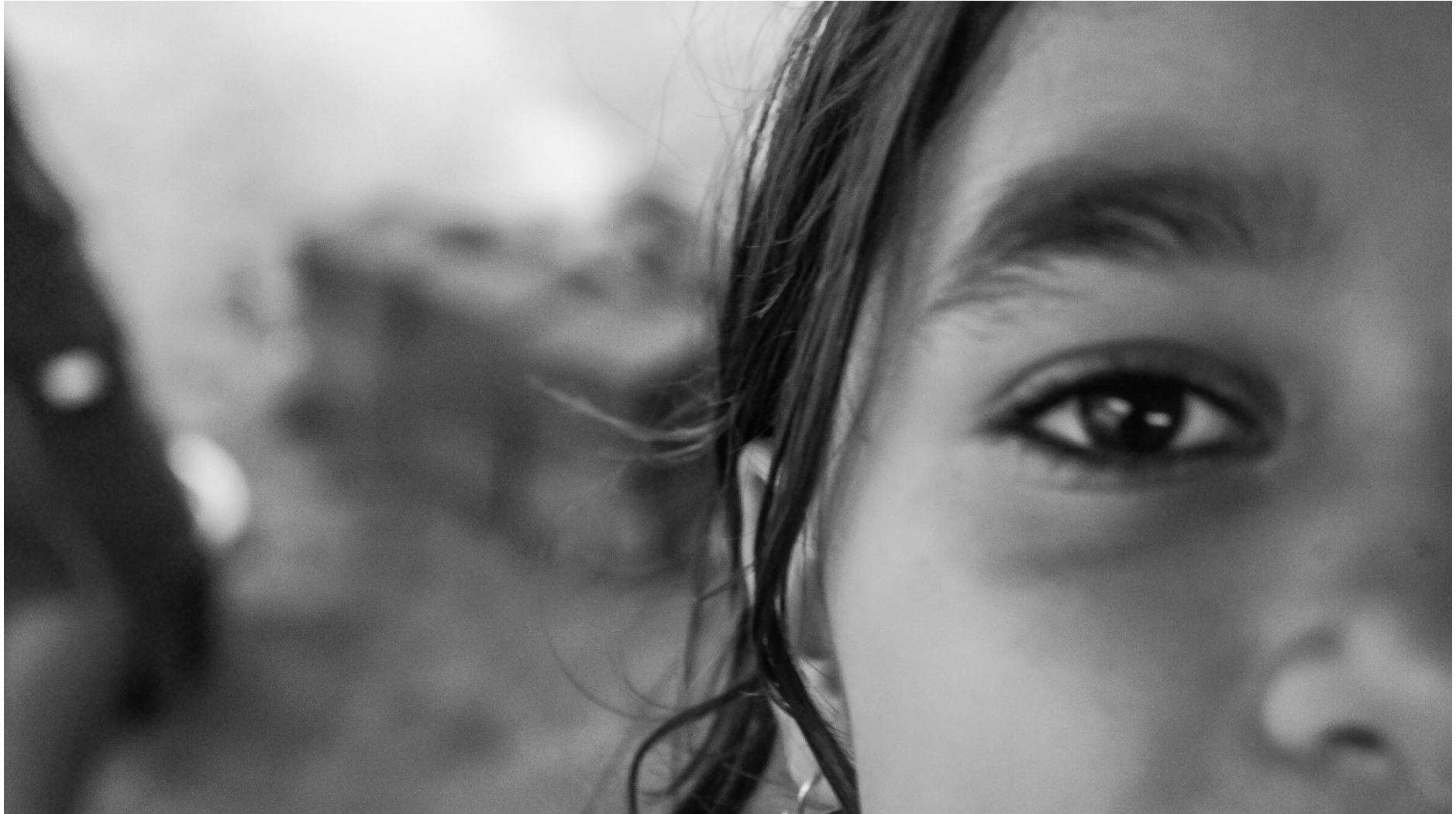
A festa em preparo: Observando o fogo pelo olhar da fotografia.