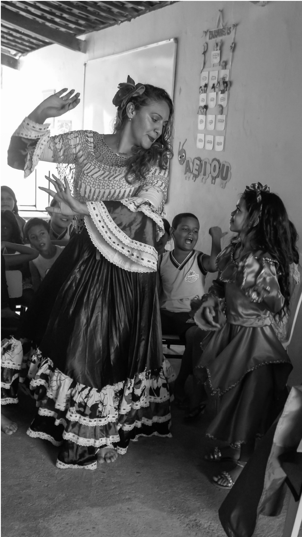
Aprendendo a dança no movimento da festa