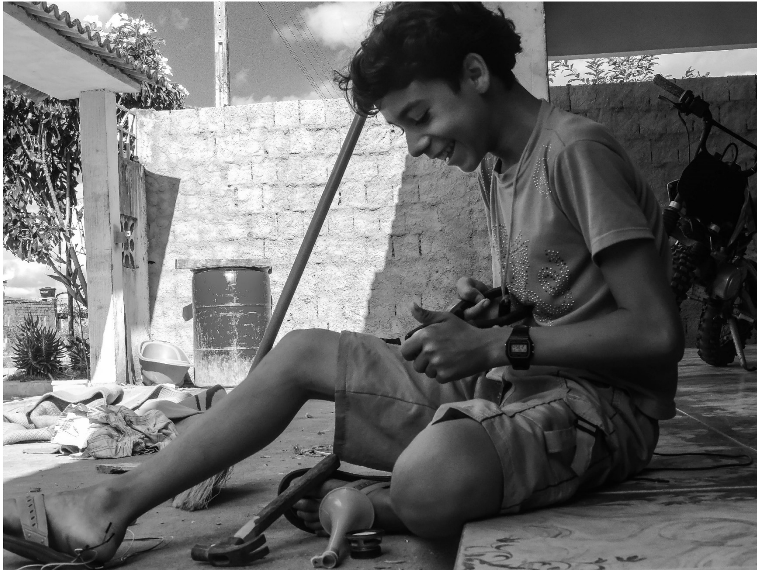
Construindo caixa de som