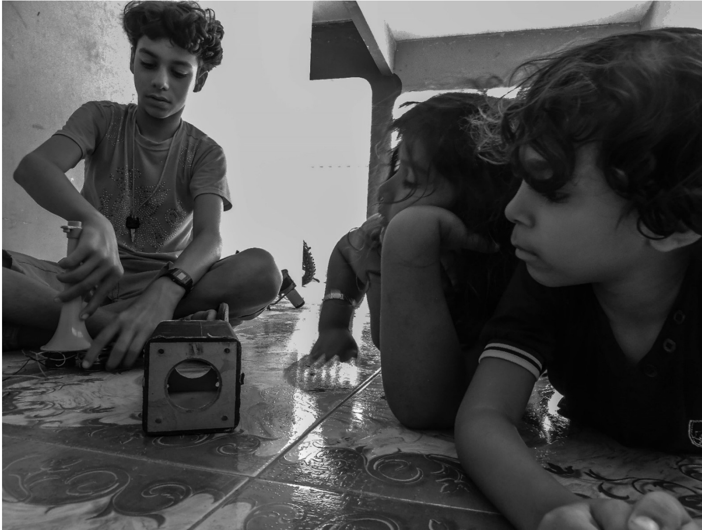
Ensinando como faz

“Para conhecer sobre a educação, necessitava, antes de tudo, conhecer sobre a vida, e como ela se constitui dentro da lógica do grupo, ou seja, pensar quais elementos são postos na rede de ensino-aprendizagem (...).” (Edilma Monteiro, 2017 “A infância Calon é um período que compreende a proteção dos familiares para com suas crianças, principalmente seus pais, mas também é o período da aprendizagem, momento no qual as crianças aprendem sobre o ser Calon e Calin(...).” (Edilma Monteiro 2015)