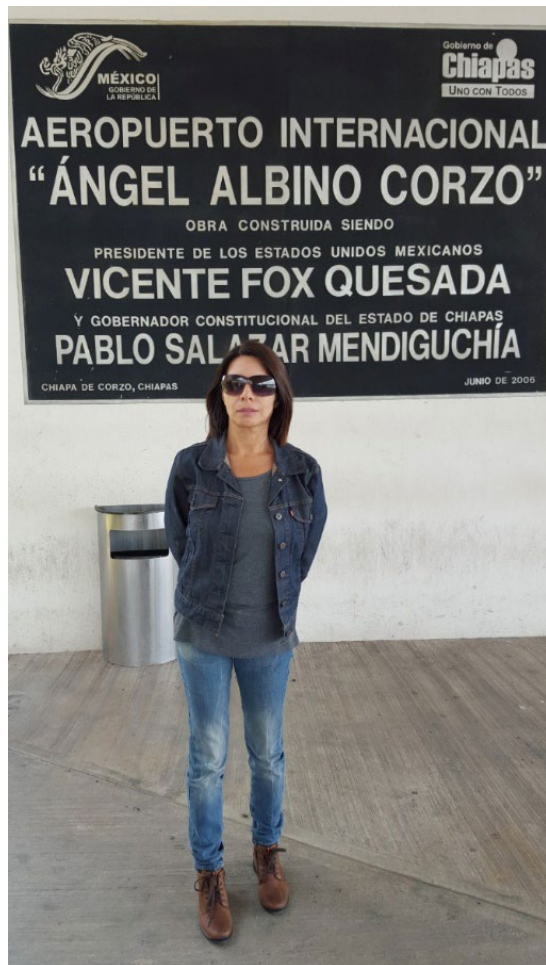
Foto 2: Llegada a Tuxtla Gutiérrez, septiembre de 2015.