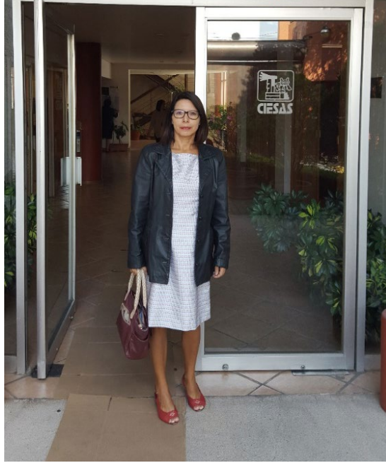
Foto 1: Llegada al CIESAS. Ciudad de México, septiembre de 2015.