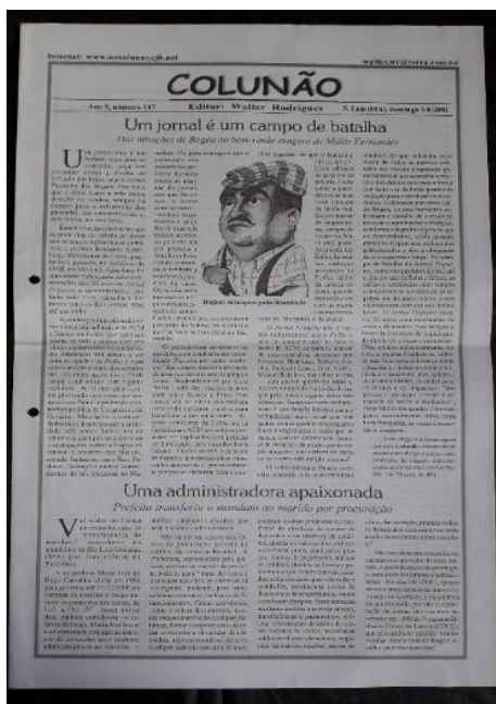
Um jornal é um campo de batalha - Das intuições de Bogéa ao bem-vindo exagero de Millôr Fernandes.