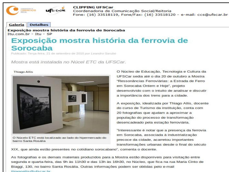
FIGURA 1: Clipping : exposição mostra história da ferrovia de Sorocaba.