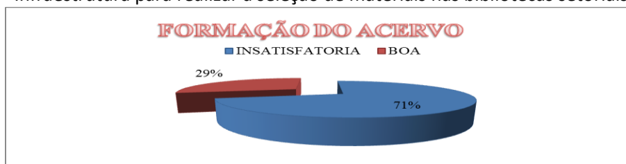
Gráfico 3 – Infraestrutura para realizar a seleção de materiais nas bibliotecas setoriais da UFPE

Quando perguntado as razões para realização da política de seleção na biblioteca, destacamos as respostas que mais se repetiram, essas apresentam a atualização do acervo, a questão da qualidade (acervo), assim como atender as necessidades informacionais. A quinta lei proposta por Ranganathan, que enfatiza que a biblioteca é um organismo em crescimento, serve como norte para as bibliotecas controlar seu acervo de acordo com as necessidades dos usuários dessa unidade. Este “último preceito, como os demais, conserva alto nível de atualização e adequação à dita sociedade da informação ou sociedade do conhecimento ou sociedade da aprendizagem” (TARGINO, 2010, p.123).