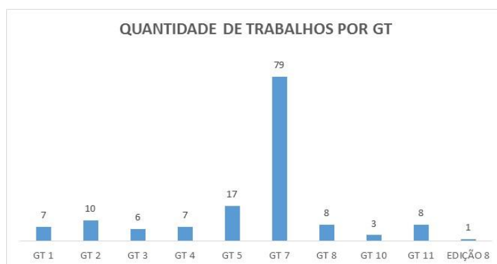
Gráfico 2 – Quantidade de trabalhos recuperados por GT