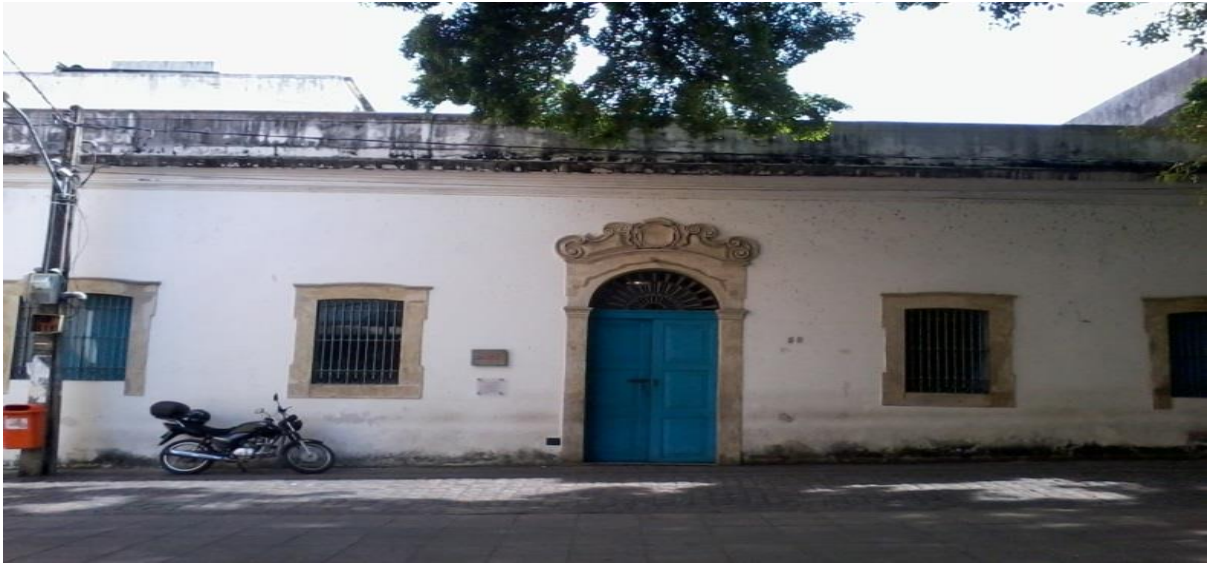
Figura 1 - Antigo prédio do Erário. Localizado na Praça Rio Branco, Centro Histórico de João Pessoa, abriga o Centro de Documentação do IPHAN na Paraíba