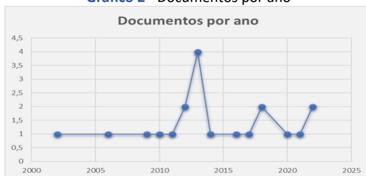
Gráfico 2 - Documentos por ano

Com a realização da leitura flutuante dos 38 documentos, aplicando-se os critérios de inclusão e exclusão, 20 documentos foram selecionados para compor o portfólio de estudo. Os Gráficos 2 e 3 apresentam os 20 documentos por ano de publicação e tipologia documental, respectivamente.