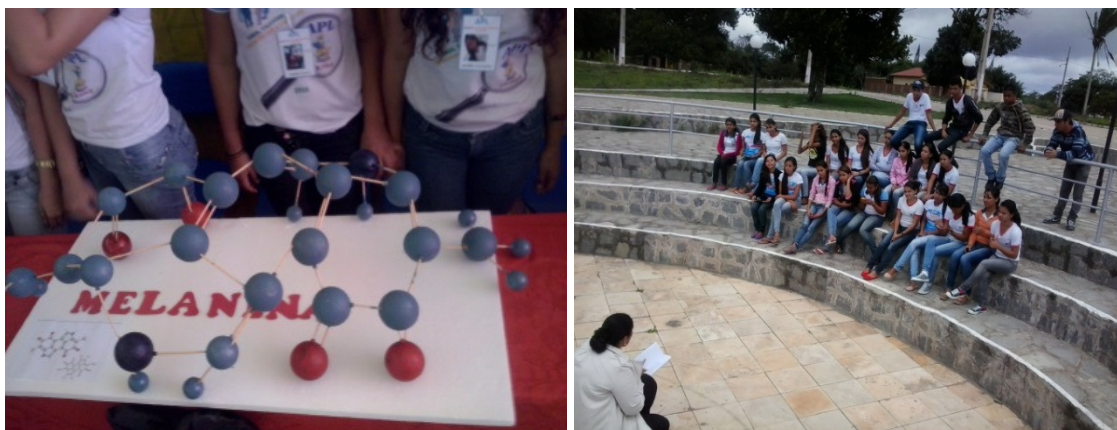
FIGURAS 1 e 2 – Campanhas de conscientização contra a prática do racismo.

impostas neste trabalho, verificamos de forma satisfatória a participação coletiva e interdisciplinar dos educandos.