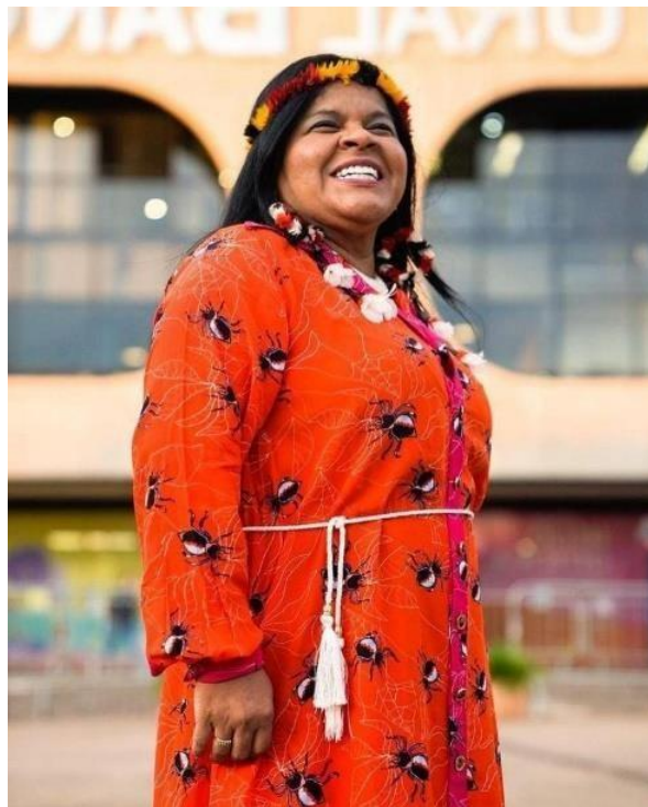
Figura 2- Imagem de Sônia Guajajara.

No início das coletas desta pesquisa, Célia era candidata a deputada federal pelo Estado de Minas Gerais, pelo PSOL-MG e apostou no lema: “É hora de Minas de Cocar! É hora de Célia Xakriabá – 5088”. Célia ocupou seu espaço político com mais de cem mil votos, logo após, assumiu o cargo de ministra dos Povos Originários. Entre as propostas para o mandato, estão a demarcação dos territórios indígenas e a titulação dos quilombos.