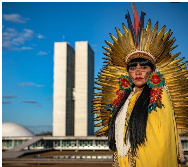
Figura 1- Imagem de Célia Xacriabá em Brasília.

O ponto de partida deste parágrafo se dá com a frase que evidencia Célia Nunes Correa (Figura – 1) também conhecida como Célia Xakriabá; “Antes do Brasil da coroa, existe o Brasil do cocar”, mulher, docente e deputada federal indígena do povo Xakriabá em Minas Gerais, Brasil.