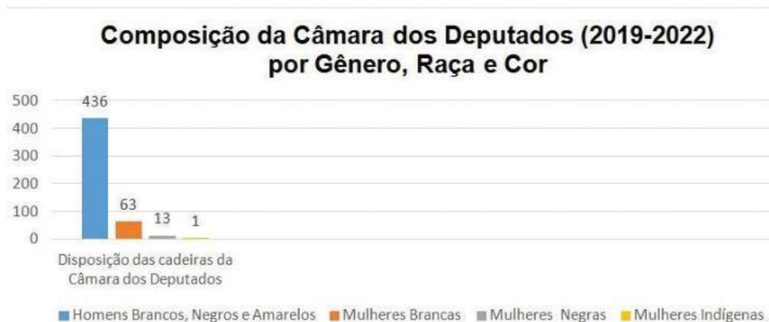
Gráfico 1 – composição da Câmara dos Deputados de 2019-2022. Fonte: Gráfico criado pelo pesquisador, 2024.

O (Gráfico – 1), abaixo visa elucidar a problemática da sub representação feminina no que tange às desigualdades étnica e racial. Ele apresenta a composição da Câmara dos Deputados para o período, por gênero e raça/cor dos parlamentares.