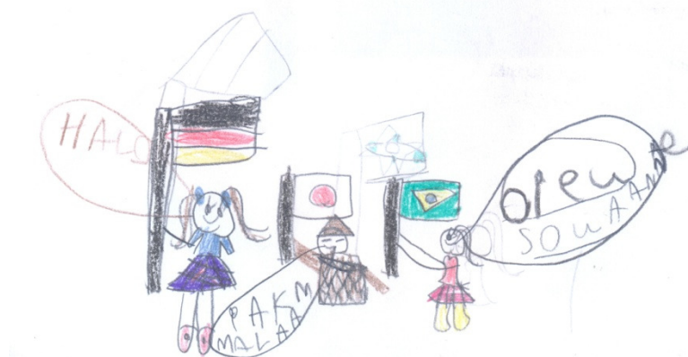
Imagem 01: Bilinguismo

Ao representar a “fala” das personagens, a criança explicita sua concepção de que a língua se atualiza por meio de sua realização. Pode-se deduzir que para esta criança, língua remete a discurso. Tal posicionamento reflete sua implicação pessoal com sua língua materna, colocada no mesmo patamar da língua estrangeira. Sua postura em pautar as línguas em contexto bivalente talvez não seja a mesma que manifestaria uma criança que aborda um código enquanto língua estrangeira.