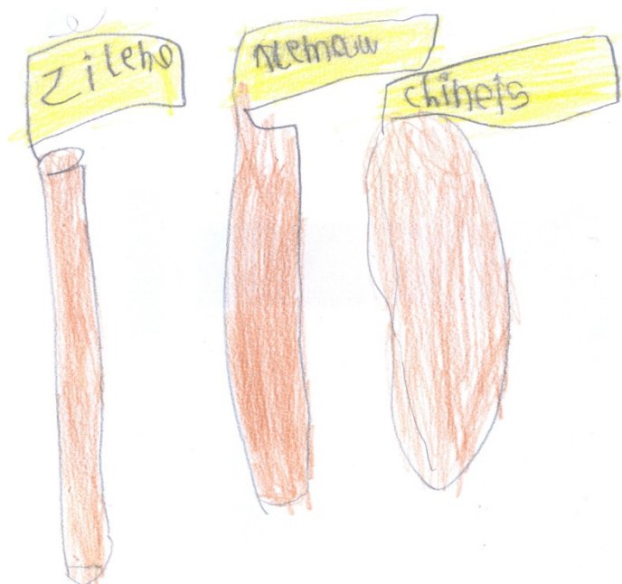
Imagem 03: Bilinguismo