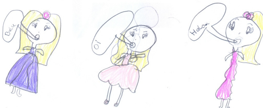
Imagem 02: Bilinguismo

O desenho que segue traz representação similar à produção anteriormente examinada. Os balões de diálogos que substituem a expressão verbal, reproduzem o recurso amplamente empregado em histórias em quadrinhos e, inclusive, do próprio manual de alfabetização em alemão utilizado na escola na qual a pesquisa foi realizada. Segundo a própria criança, há somente uma personagem no desenho, representando a si mesma em três momentos distintos. Em cada uma delas uma situação discursiva diferente. Novamente, a criança explicita sua posição de colocar língua e discurso no mesmo patamar.