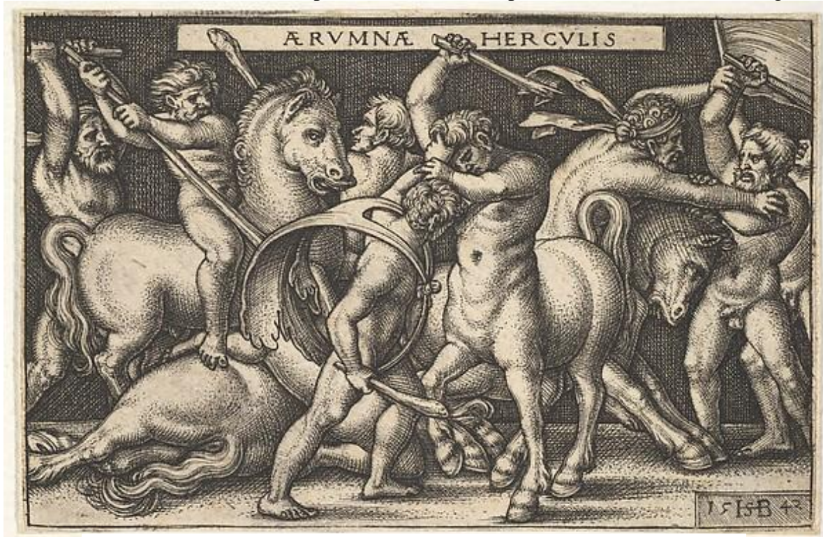
Figura 2: Arvmnae Hercvlis; Hércules luta contra os Centauros. Hans Sebald Beham, 1542.

de Cronos , era imortal. Em contrapartida, Prometeu só poderia ser salvo de seu castigo