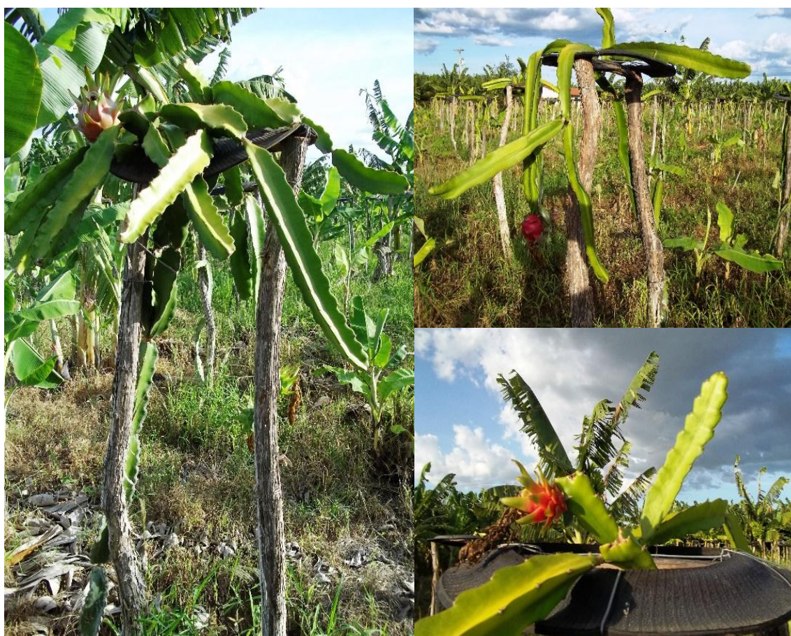
Figura 2 - Manejo de pitaia por produtores na Chapada do Apodí, Ceará, Brasil.

Embora a colheita da pitaia seja realizada quando o fruto atinge estágio completo de maturação, não há um consenso sobre o comportamento climatérico destes frutos (Duarte 2013). Alguns estudos realizados incluem a pitaia dentro do grupo dos frutos climatéricos (Camargo e Moya 1995), enquanto outros autores, com base na baixa produção de caracterizam a pitaia como apresentando comportamento não climatérico (Nerd et al. 1999).