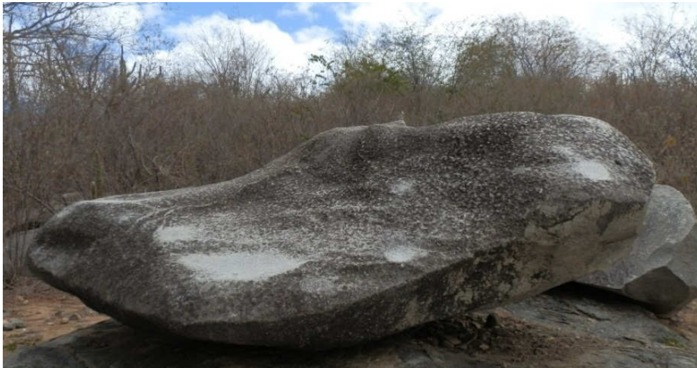
Figura 2. Pedra do sino.

Além disso, existem a Pedra do Sino (Figura 2), que recebe este nome por ter o som semelhante ao de um sino de bronze e a Pedra do Letreiro que recebe este nome devido as inscrições grafadas na pedra deixadas pelos antepassados à povoação do município, elas datam de 4.000 a 9.400 anos antes do presente, sendo figuras de mão e círculos, riscos a princípio sem forma, mas que para aqueles povos tinham seu significado, assim como a escrita tem para os humanos da atualidade (NASCIMENTO & FERREIRA, 2012).