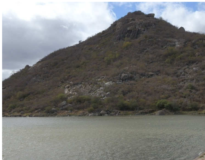
Figura 5. Açude Totoró.

Além disso, o Povoado Totoró também possui um reservatório de água denominado Açude Totoró (Figura 5). O reservatório serve para o abastecimento da comunidade Totoró, assim como para as plantações de vasantes, além do lazer que o mesmo proporciona para pessoas que vem de toda a região do Seridó para conhecê-lo (NASCIMENTO&FERREIRA, 2012)