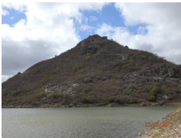
Figura 1. Pico Totoró.

No que diz respeito às presenças rochosas existentes no Povoado Totoró podem ser enfatizadas algumas questões como o fato de a Pedra do Caju ser uma geoforma que recebe esta denominação por ter um formato semelhante à fruta, situa-se em uma ilha do Açude Totoró medindo duzentos metros quadrados, e a pedra mede, aproximadamente, quatro metros de altura por quatro metros de largura.