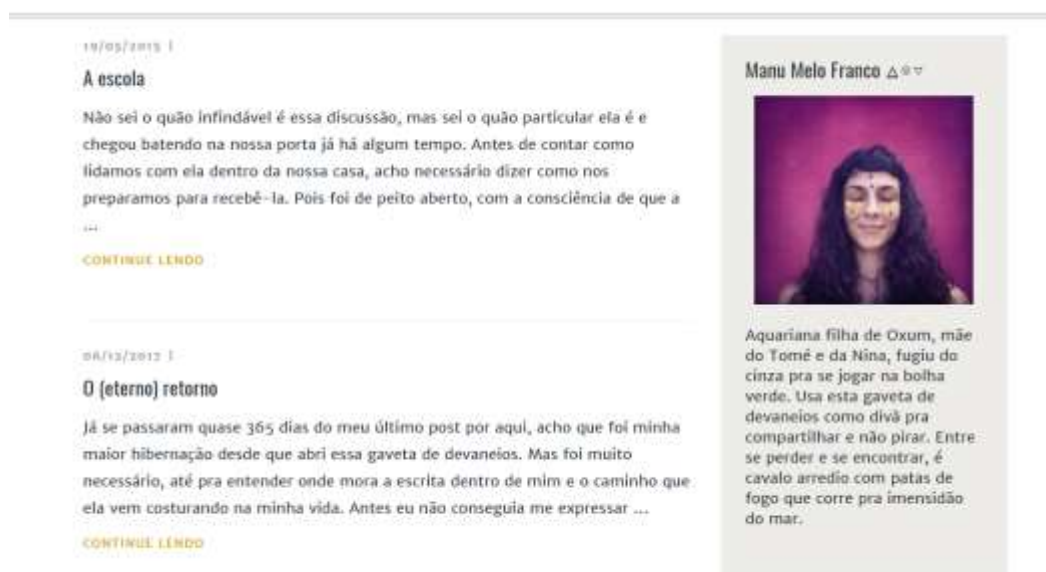
Figura 1 – postagem do blog “Notas sobre uma escolha”