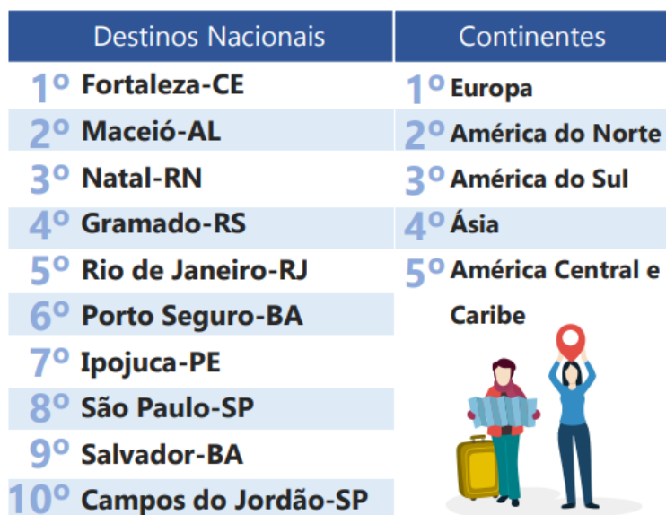
Figura 1: Ranking de destinos mais procurados nos meses de junho e julho de 2019.