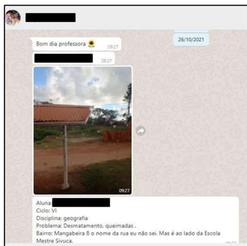
Figuras 5. Problemas verificados, registrados e relatados pelos(as) estudantes: desmatamento, queimada, falta de calçamento – Mangabeira 8 – João Pessoa/PB.