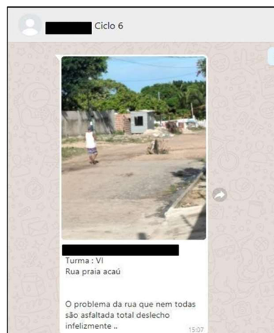
Figuras 6. Problemas verificados, registrados e relatados pelos(as) estudantes: falta de calçamento – Mangabeira 8 – João Pessoa/PB.