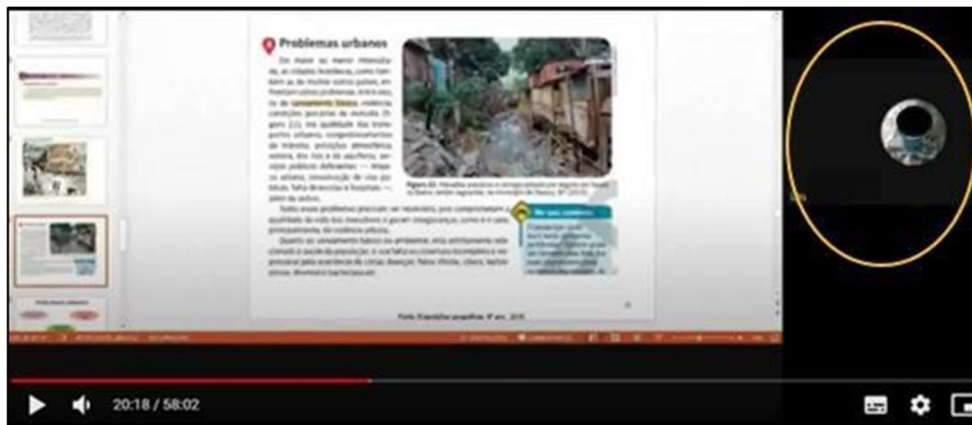
Figura 2. Participação dos alunos – Aula no Google Meet