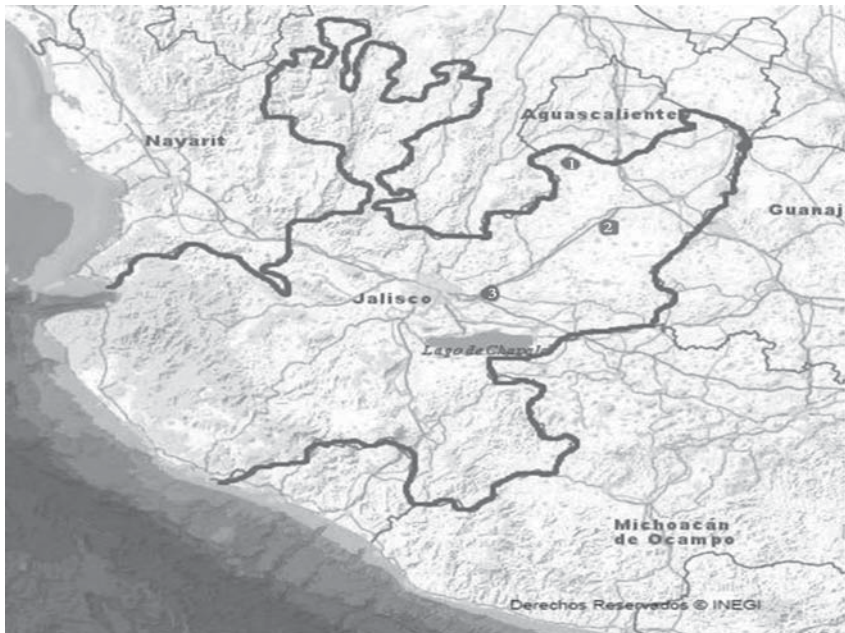
Mapa 1 - Ubicación de las comunidades estudiadas

Legenda: 1 Villa Hidalgo – 2 San Miguel el Alto – 3 Zapotlanejo