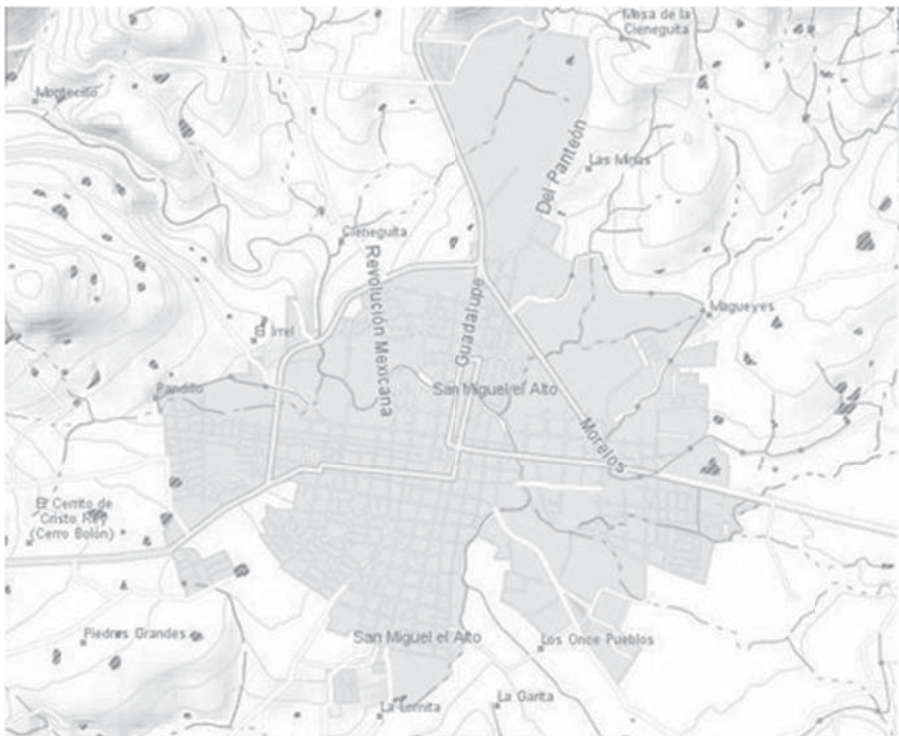
Mapa 4 -San Miguel el Alto, Jalisco