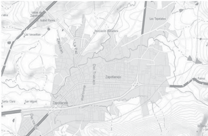
Mapa 2 - Zapotlanejo, Jalisco