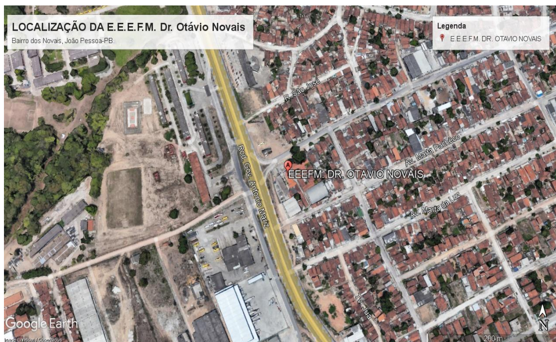
Figura 1 – Imagem de satélite de localização da E.E.E.F.M. Dr. Otávio Novais