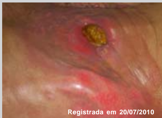
Figura 1. Registro fotográfico da pele periestoma acometida pela dermatite