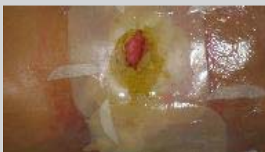
Figura 2. Registro fotográfico da utilização dos protetores percutâneos em 02/08/2012.