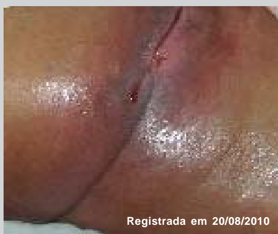
Figura 3 - Registro fotográfico da evolução da dermatite periestoma e do fechamento do estoma