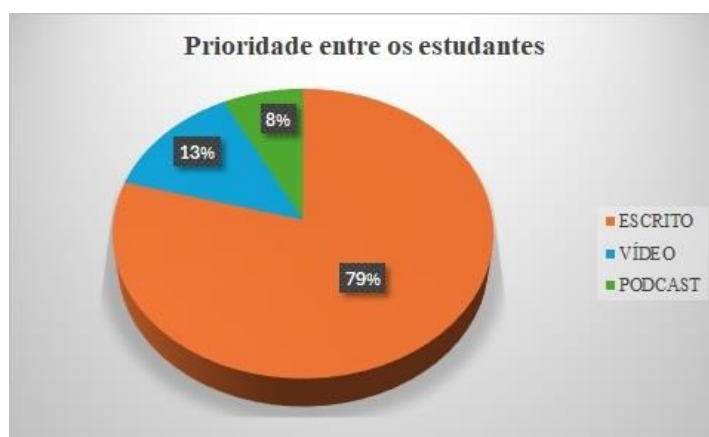
Gráfico 3 – Preferência de dispositivos de produção de texto pelos estudantes das turmas de 9º ano do Ensino Fundamental.

preferência na (re)elaboração de texto. Após as conversas, em que foram perguntados sobre o formato do texto e o prazer durante sua produção (se de modo escrito, imagético em vídeo ou sonoro como podcast), foi possível identificar, como demonstra o Gráfico 3, que, em sua maioria, os estudantes priorizam a produção do texto escrito; em segundo, a produção imagética e, por último, a sonora.