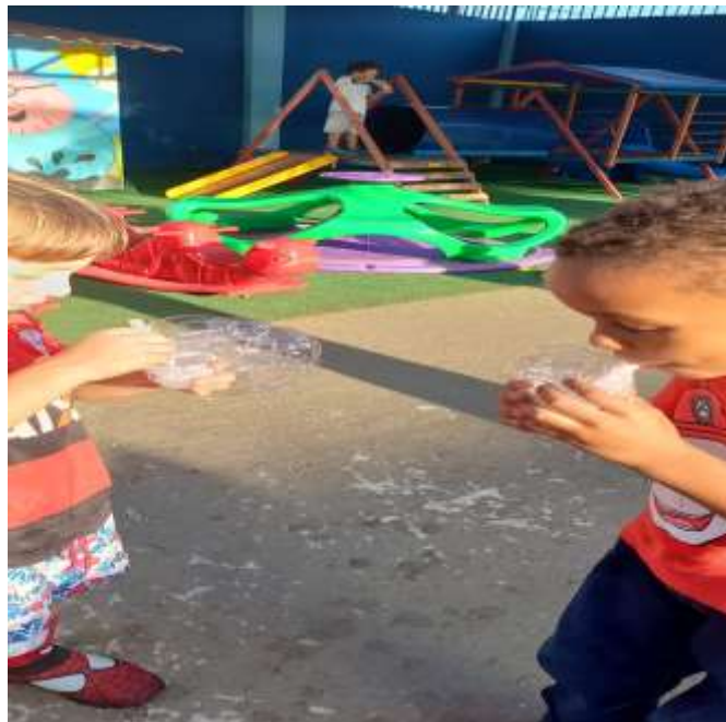
Imagem 7 – Produção de bolhas de sabão como atitude inclusiva