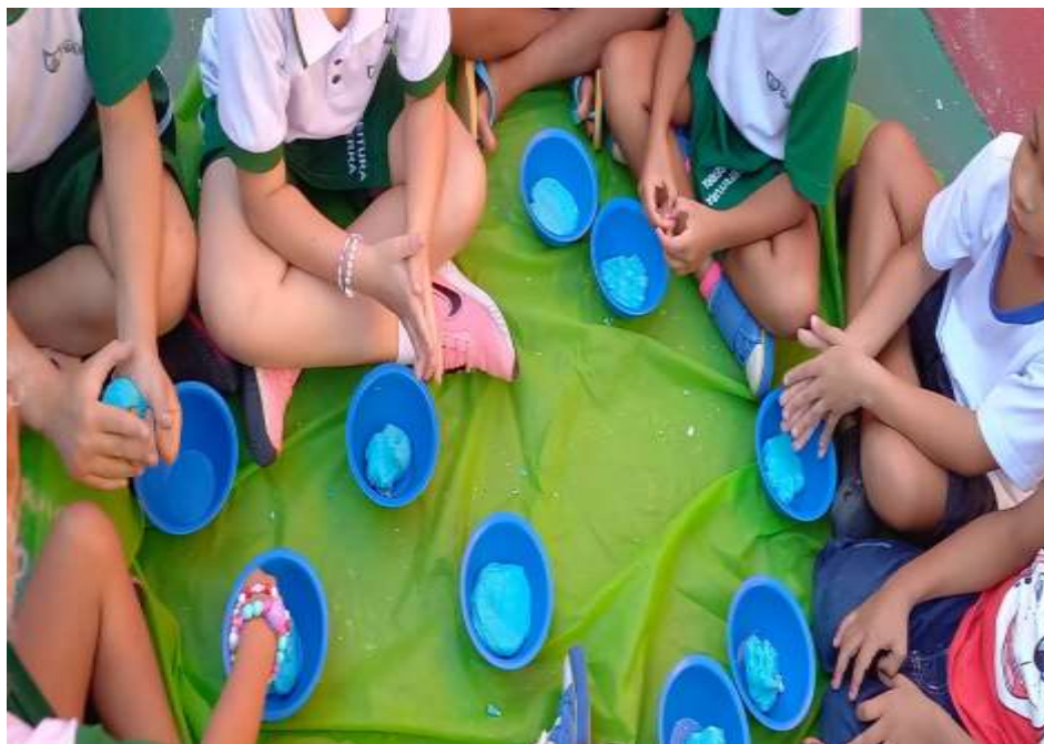
Imagem 4 – Produção de massinha como encontro e escuta de si

Ora, agenciar transformações, resistir perpassam pela experimentação de outras maneiras de fazer, pela invenção de novos modos de aprender. Experimentar a escola inventivamente se torna, assim, possibilidade de aprender com alegria pela potência da busca, pela sensibilidade dos encontros e pela diferença da composição com os espaços, tempos e coletivos nas vivências experimentadas.