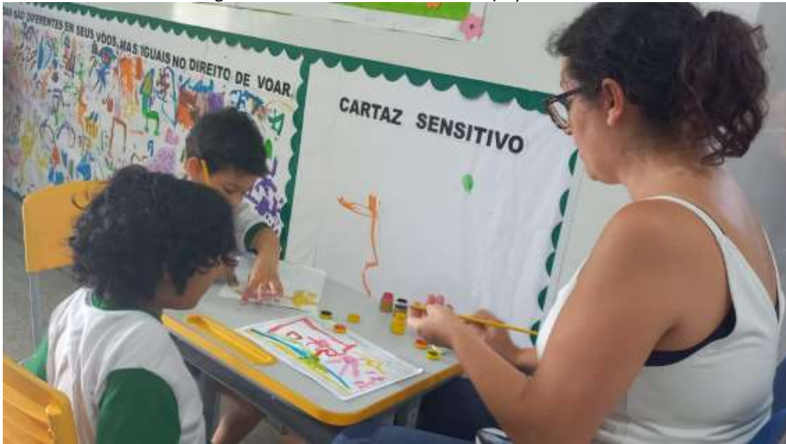
Imagem 1 – Atividades em diferentes espaços do CMEI