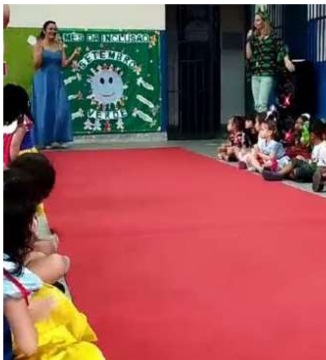
Imagem 3 – Desfile no CMEI: setembro verde - Todo mundo é especial

Em meio à vida que pulsa nos contextos escolares, o mês de setembro, intitulado de setembro verde ou mês da inclusão, foi tecido por experimentações brincantes no CMEI, como apontado na imagem a seguir. Ressalta-se que tais atividades não acontecem somente no setembro verde, mas no decorrer do ano letivo. A promoção de atividades diversificadas e inclusivas se colocam como resistência, produção sensível e alternativa aos modos que engessam a vida, que delimitam e enquadram a criança da educação especial e a criança que não compõe a educação especial. Afinal, somos todos especiais.