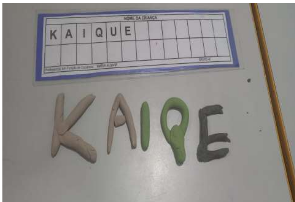
Imagem 5 – Produção escrita e com massinha