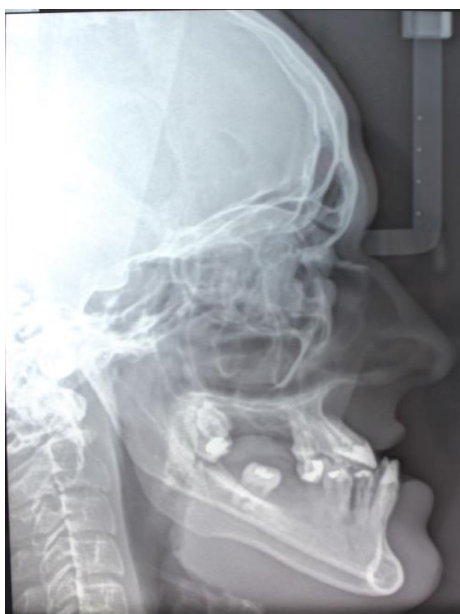
Figura 4. Telerradiografia de Perfil.