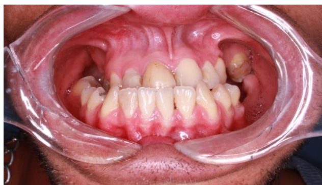
Figura 1. Aspecto clínico inicial.

avaliação, planejamento e conduta de cirurgia ortognática. Ao exame físico foi observado que o paciente possuía deformidade dento facial, classe III de Angle, com excesso antero posterior de mandíbula associada a deficiência transversa de maxila, com mordida cruzada porterior e anterior, que o enquadravam em necessidade de cirurgia ortognática (Figuras 1 e 2). No plano de tratamento cirúrgico foi proposto realizar uma expansão maxilar para aumentar a dimensão lateral, nivelamento e alinhamento, seguidos de avanço da maxila e retrusão mandibular.