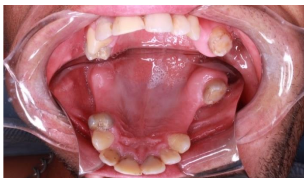
Figura 2. Aspecto clínico inicial.

Foram solicitadas radiografia panorâmica e teleradiografia de perfil (Figuras 3 e 4), onde foi evidenciado a presença de um elemento dental incluso em região posterior de maxila direita, sugerindo um terceiro molar incluso. O dente poderia ser removido durante a cirurgia ortognática, entretanto, optou-se por realizar a remoção do elemento dental antes do procedimento, utilizando anestesia local, e por acesso intraoral, com o objetivo de facilitar o transoperatório, o qual já apresentaria uma complexidade maior devido à estrutura dos maxilares (Figura 5).