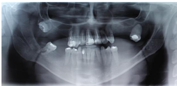
Figura 3. Radiografia Panorâmica.