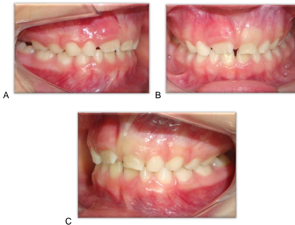
Figura 1. 1-A: Aspecto clínico intraoral da face vestibular em vista lateral direita evidenciando aumento de volume no dente 11. 1-B: Aspecto clínico intraoral da região anterior da face vestibular. 1-C: Aspecto clínico intraoral da face vestibular em vista lateral esquerda, observa-se aumento de volume e coloração pálida na gengiva correspondente ao dente 61.

alveolar vestibular do dente 11 (figura 1-A), já na região do dente 61, encontra-se pálida (figura 1-C). Na região palatina, não houve alteração (figura 2).