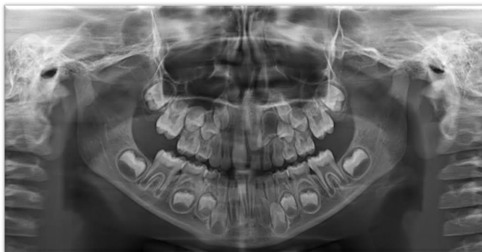
Figura 4: Radiografia panorâmica dos maxilares evidenciando agenesia do dente 22 e uma imagem radiolúcida de formato circular delimitada por um halo radiopaco.