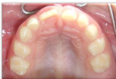
Figura 2: Aspecto clínico intraoral da lesão, região palatina.

Figura 1. 1-A: Aspecto clínico intraoral da face vestibular em vista lateral direita evidenciando aumento de volume no dente 11. 1-B: Aspecto clínico intraoral da região anterior da face vestibular. 1-C: Aspecto clínico intraoral da face vestibular em vista lateral esquerda, observa-se aumento de volume e coloração pálida na gengiva correspondente ao dente 61.